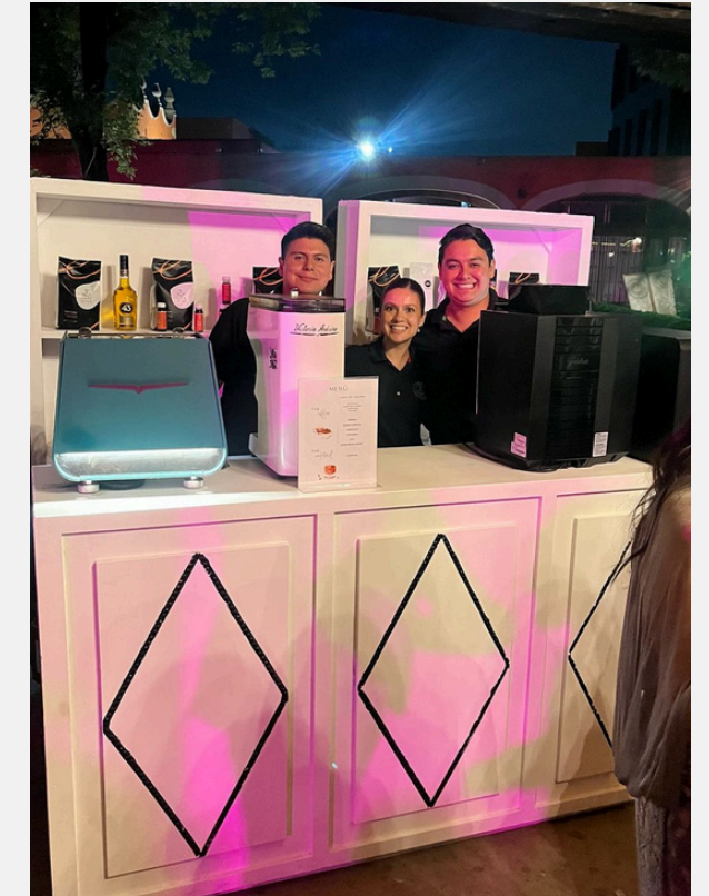
Montaje de Barras Eventos múltiples