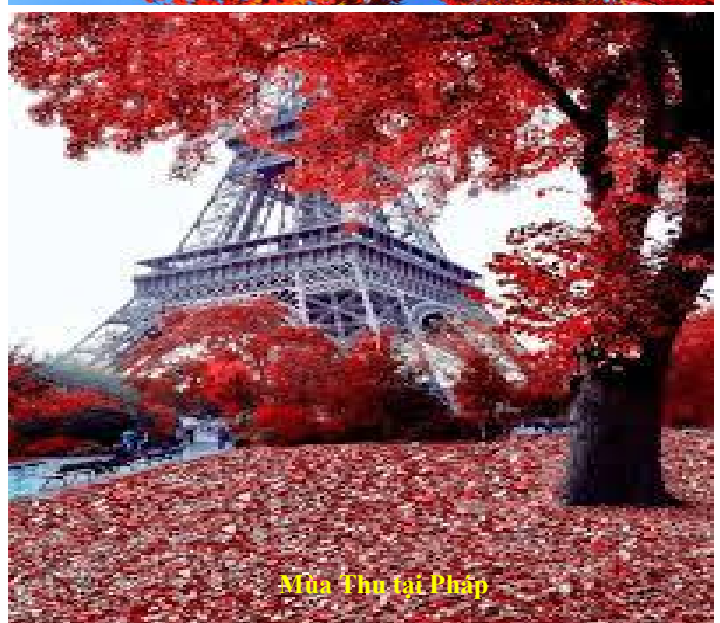
Mùa Thu tại Pháp