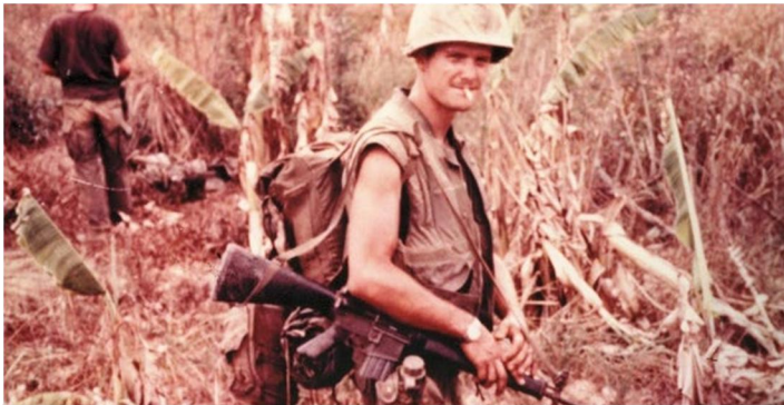
Hình 4: Jim Webb giữa trận địa Chiến tranh Việt Nam, năm 1969 do chiến công anh dũng Trung Úy TQLC Jim Webb được thưởng Navy Cross là một huy chương cao quý của Hải quân & TQLC Mỹ, chỉ đứng thứ hai sau Medal of Honor do Quốc hội vinh danh và Tổng thống Mỹ trao tặng.