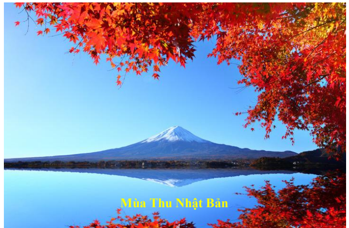
Mùa Thu Nhật Bản

Mùa Thu với lá vàng rơi, với mưa phùn, gió Thu nhè nhẹ gợn sóng mặt nước hồ Thu vẫn là mùa gây nhiều cảm hứng nhất cho các văn nhân, thi, nhạc sĩ từ bao đời. Có người cho mùa Thu buồn quá, không rực rỡ như mùa Hè với hoa Phượng đỏ, với nắng đẹp, không đẹp như mùa Đông với hoa tuyết rơi trắng xoá mái nhà, nhìn tuyết rơi hắt cững lãng mạn và đẹp. Mùa Thu không vui như mùa Xuân với hoa Mai, hoa Đào, hoa Cúc nở rộ. Mùa Thu buồn quá. Nhưng chắc hẳn con người cũng cần có những lúc buồn. Buồn để nhớ lại những gì trong quá khứ, những mất mát, nuối tiếc những gì đẹp đã đánh mất. Có lẽ do vậy mà mùa Thu vẫn là mùa được chọn cho những bài thơ, văn, ca nhạc lãng mạn