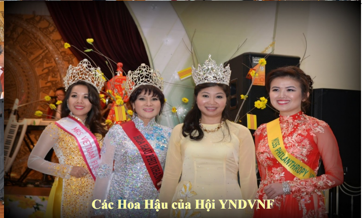
Các Hoa Hậu của Hội YNDVNF