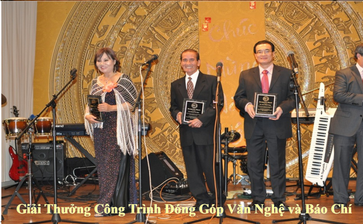
Giải Thưởng Công Trình Đóng Góp Văn Nghệ và Báo Chí