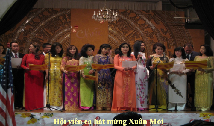
Hội viên ca hát mừng Xuân Mới