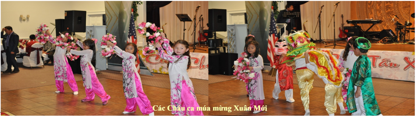
Các Châu ca múa mừng Xuân Mới