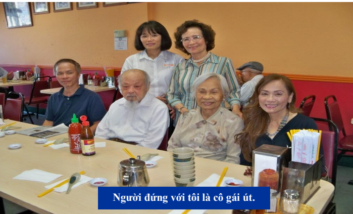
Người đứng với tôi là cô gái út.