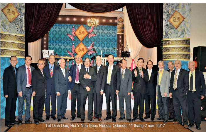
Tết Đinh Dậu, Hội Y Nha Đuoc Florida, Orlando, 11 tháng 2 năm 2017

As guests started to arrive, they gathered together to socialize, wish one another a happy new year and take pictures. Meanwhile, members of the Board of Directors and Executive Officers held a meeting to follow up on administrative business and get acquainted with new executive members.