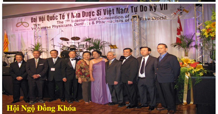
Hội Ngộ Đồng Khóa