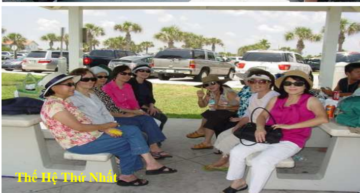
Thế Hệ Thứ Nhất