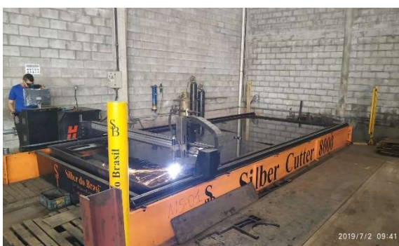
Mesa de corte plasma CNC / Oxicorte 6.300 x 2.600mm - Silber.