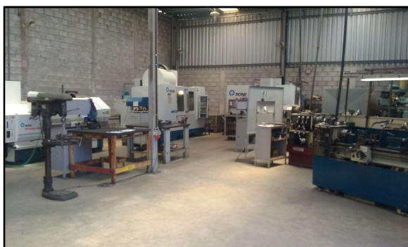
Oficina com centros de usinagem e tornos CNC, fresadoras, e tornos convencionais.