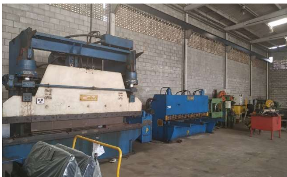
Estrutura para atender e auxiliar demandas de Caldeiraria.