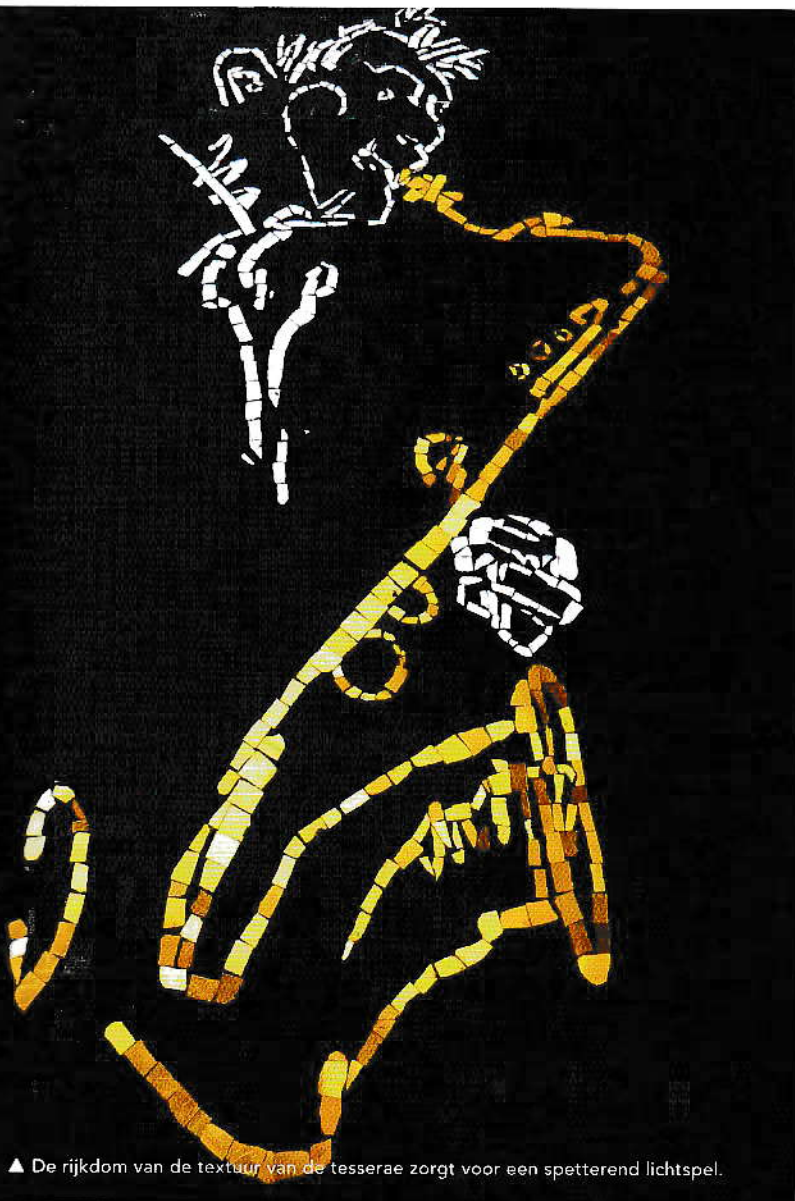
▲ De rijkdom van de textuur van de tesserae zorgt voor een spetterend lichtspel.