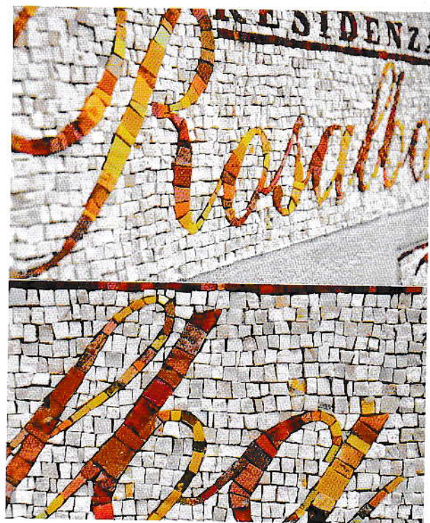
▲ Logo uitgevoerd in mozaïek.