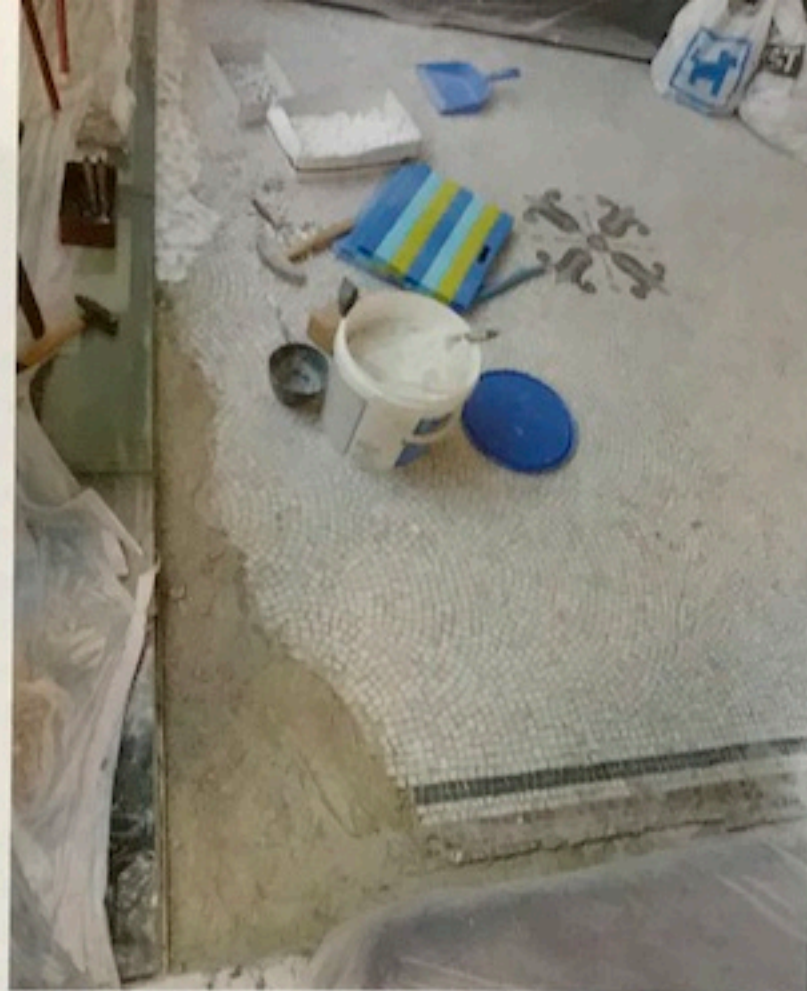
Bij het restaureren van mozaïekvloeren vraagt de ondergrond ontzettend veel aandacht