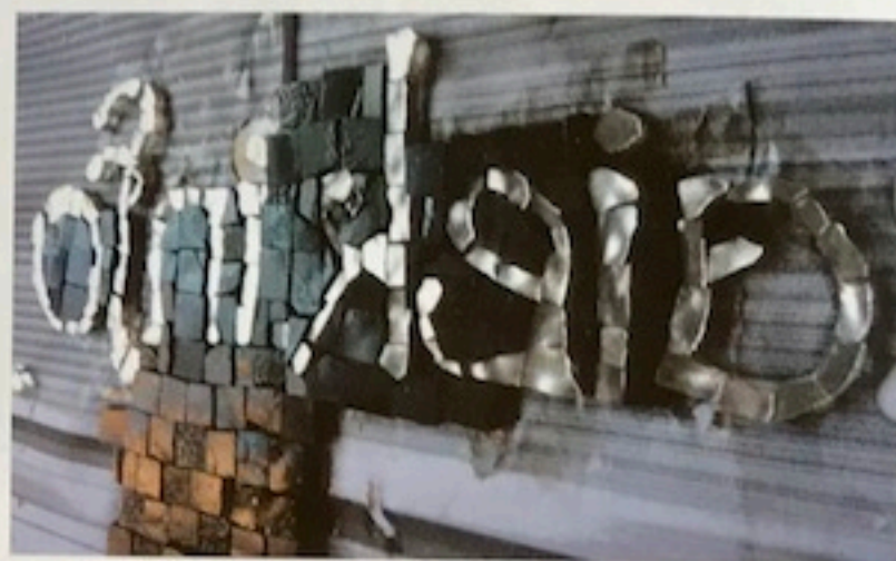
Werk in uitvoering

hypothekeren en een behoorlijk eindresultaat in de weg staan. Zeker op langere termijn.”