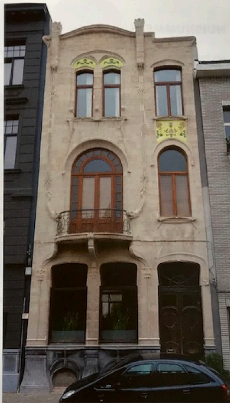
Art nouveau pand 't Daghet in den Oosten in Antwerpen na de restauratie

"Of ook soms starten vanaf nul", repliceert Rawls, "Zo kreeg ik onlangs een opdracht voor het restaureren van