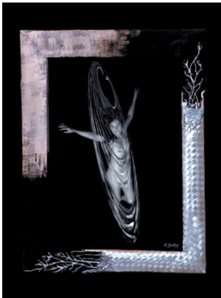
Mike Lindtner; All I dream about; Digital Painting © Mike Lindtner

in seinen einzigartigen Kompositionen die schönen Frauenkörper mit Linien und Gestaltungsformen zu verschmelzen versteht, die einerseits die sensuell einzigartige Harmonie der Komposition unterstreichen, andererseits eben jene Seelenräume öffnen, die durch Identifikation und Abstraktion und den sensibel intuitiven Prozess ermöglicht werden. Ob man will oder nicht, man versinkt in ihrer Gegenwart in einer Welt der Stille, betritt im Rahmen der Betrachtung Schicht um Schicht immer tiefere und oft wunderschöne Seelenwelten. Vertiefung zum einen, ein Gefühl von Freiheit zum anderen, wird in seinen Fotokompositionen zum Erlebnis und auch zum Statement! Eine Kunst vielleicht ein wenig in der Tradition „l'art pour l'art“, also der „Kunst um der Kunst willen“? In seinem Film „Gegenwelt“ sagt er zum Auftakt: „Ich lasse mir von der Realität nicht vorschreiben, wie ich die Dinge sehe“ – ein schöner Gedanke