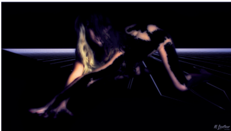
Mike Lindtner; Confusion; Digital Painting © Mike Lindtner

gerade im Bensheimer Fürstenlager, einem Kleinod, herrliche Ausstellungsreihen initiiert. Die Werke von Mike Lindtner zeichnen sich durch eine tiefe emotionale Resonanz und eine surreale, traumhafte Atmosphäre aus. Durch seine digitalen Malprozesse verleiht er seinen Bildern eine mystische Qualität, die den Betrachter in Seelenwelten reisen lässt; Reisen, die auch zur Begegnung mit sich selbst werden kann. Lindtners intuitive Fotokunst erinnert sensibel, dass die Welt voller Magie und Schönheit ist, wenn wir bereit sind, sie mit offenen Augen und einem offenen Geist zu betrachten. Ein Erlebnis, das Sammler sehr schätzen, unabhängig, ob im Rahmen der Gestaltung von privatem Raum oder um Kunst im Unternehmen.