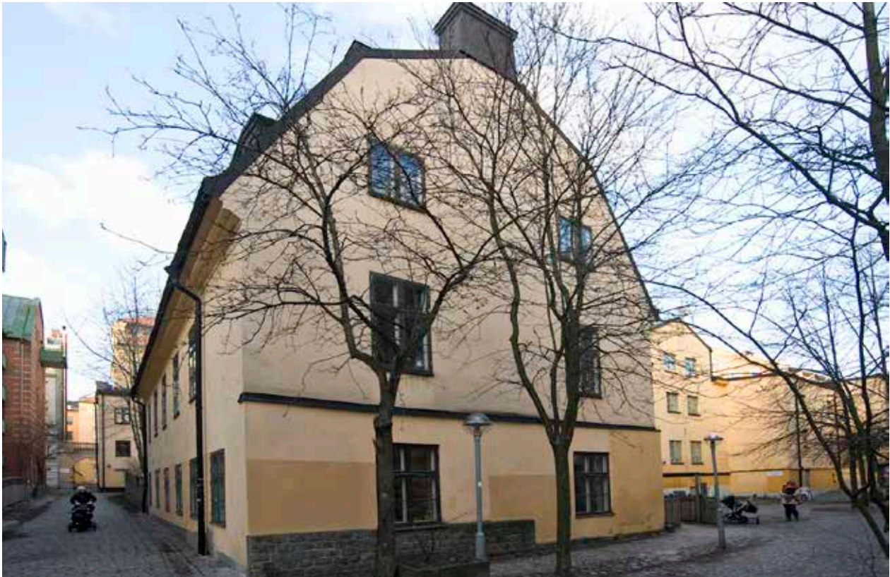
GÄRDSHUSET (NR 4) FRÅN SÖDER.

Den renoverades på 1980-talet. Ombyggnaden skedde i samarbete med Stadsmuseet. Fasaderna putsades och avfärgades med kalkfärg. Kök och santitetsutrymmen fick ny inredning.