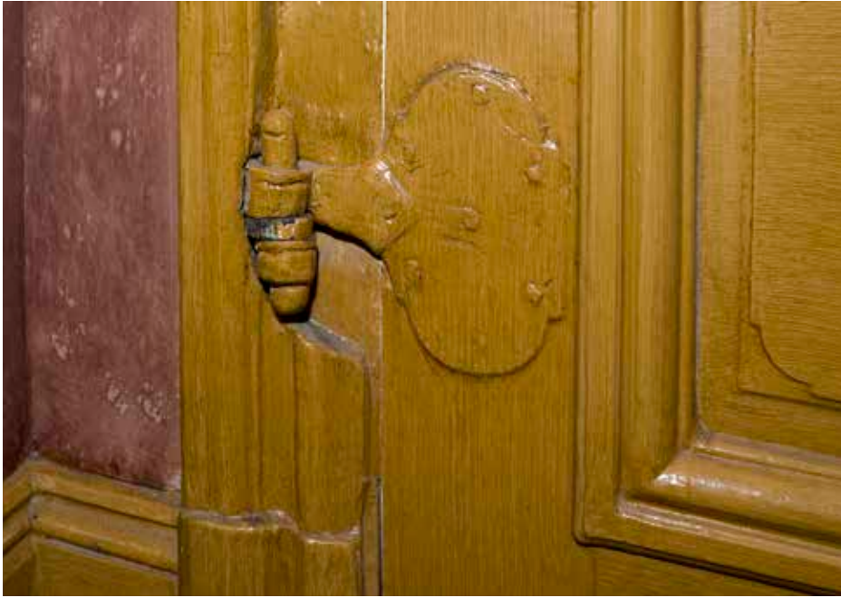
PLATTGÅNGJÄRN TILL 1700-TALSDÖRR I TRAPPHUSET I ROOS HUS (NR 1).

1980-talet och inredningen härrör till största delen från samma ombyggnad. Av det sena 1800-talets inredning återstår någon enstaka halvfransk enkeldörr, en vitglaserad kakelugn och vissa fotpaneler.