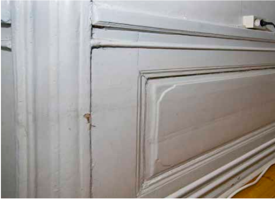
BRÖSTPANEL FRÅN 1700-TALET MED RUNDADE HÖRN. GÅRDS- HUSET (NR 4), VÅNING 1 TRAPPA.

är av granit och bottenvåningens gatufasad rusticerad. Övervåningarna är spritputsade med rik putsdekor i form av fönsteromfattningar och kartuscher. Andra våningens rundbågiga fönster är kopplade två och två med gemensamma blindbågar. Fönstren är något indragna från fasadliv. Mittaxeln i gatufasaden är markerad med en risalit genom de två övre våningarna och avslutas uppåt med en gavelfronton med året 1886 samt spira och vindflöjel. Taket är plåttäckt. Gårdsfasaden är slätputsad och har en sockel av nubbssten. På våning 1 trappa finns ett burspråk av gjutjärn. Fönstren ligger något innanför fasadlivet och saknar omfattningar. Trapploppets fönsteröppningar i byggnadens östra del är snedställda med tre rundbågiga rutor i var fönster. Mot gården finns en dörröppning till en kökstrappa i väster, stängd med ett sentida dörrblad.