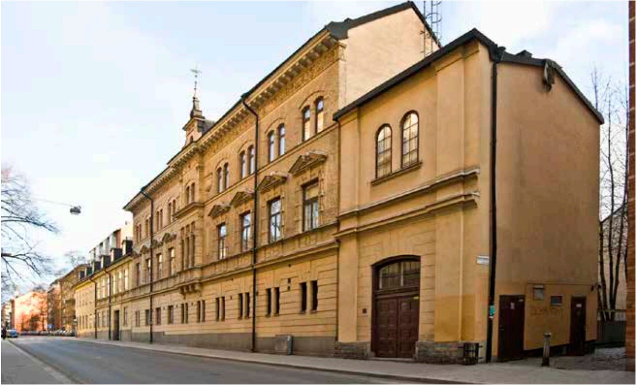
HÖBERGSGATAN FRÅN VÄSTER. NÄRMAST DEN LILLA BYGGNADEN 3B, BORTOM LIGGER DET NYA BOSTADSHUS SOM BRYGGAREN FRITZ DÖLLING LÄT UPPFÖRA 1885 (3A). YTTERLIGARE TILL VÄNSTER GATHUS 2 OCH 3.

tomt som Rases, senare Roos bryggeri upptog, samt ett gårdshus som fram till 1872 tillhörde en annan fastighet.