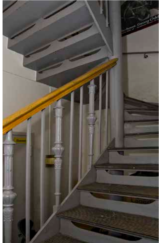
TRAPPA MED GJUTJÄRNSRÄCKE I DET ENKLARE TRAPPHUSET INOM GATHUS 3A.

och fönsterpaneler och kakelugnar på båda sidor om porten samt tre rum och ett kök på vinden.