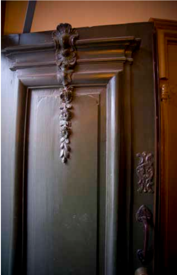
DETALJ AV YTTERDÖRREN TILL ROOS HUS FRÅN 1761 (GATHUS 1). DÖRREN HAR SNIDAD ROKOKODEKOR OCH SPEGLAR MED RUNDADE HÖRN.