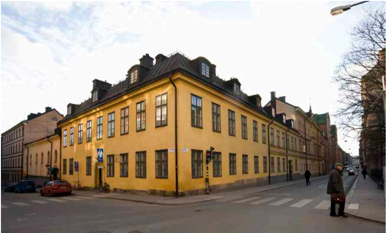
BRYGGARE ROOS BOSTADSHUS FRÅN 1761 I HÖRNEN BJÖRNGÅRDSGATAN / HÖBERGSGATAN (GATHUS 1). TILL HÖGER DET TVÅ VÅNINGAR HÖGA GATHUS 2.

Under 1600-talets slut utgjordes stora delar av befolkningen i området av bland andra hantverkare och sjöfolk. Bebyggelsen bestod framförallt av små, enkla trähus. Norr om Fatburen, som då fortfarande hade friskt vatten, etablerade sig industrier såsom bryggerier och ett sidenväveri.