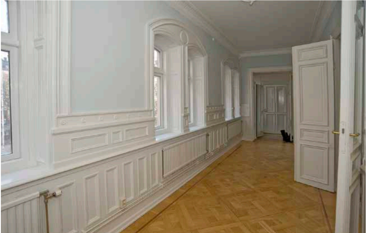
GALLERIHALL I HUS 3A. RUMMET HAR EKPARKETTGVOLV, ORNERADE STUCKLISTER OCH BRÖST- OCH FÖNSTERPANELER I SAMMA STIL SOM DE HELFRANSKA DÖRRBLADEN.