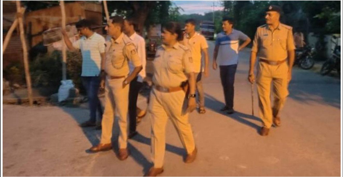
ಶಿವಮೊಗ್ಗದ ವಿವಿಧ ಪೊಲೀಸ್ ಠಾಣೆಯ ವ್ಯಾಪ್ತಿಯಲ್ಲಿ ಪೊಲೀಸ್ ರು ಕಾಲ್ನಡಿಗೇ ಗಸ್ತು ತಿರುಗಿದರು.

ಸೋಮವಾರ, 20ನೇ ಮೇ, 2024 | ● ಸಂಪುಟ-1 | ● ಸಂಚಿಕೆ-82 | ● ಉಚಿತ | ● | ● www.suddisanchaari.in