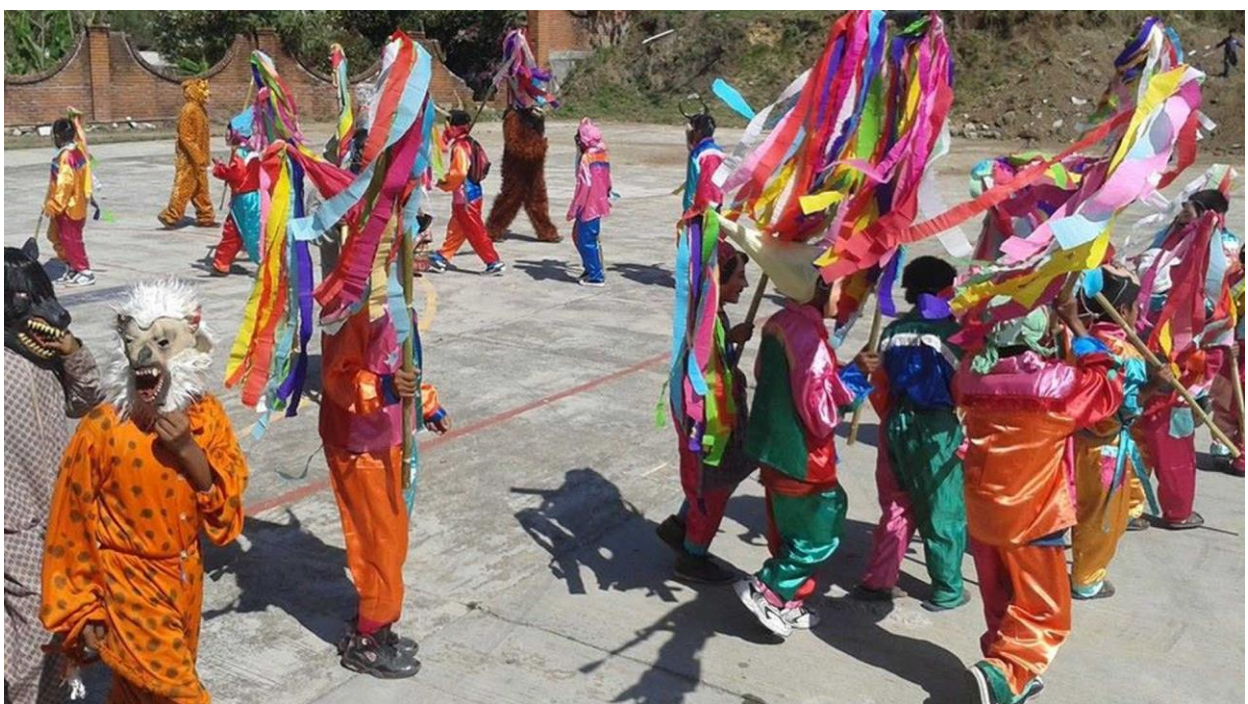
Carnaval 2015