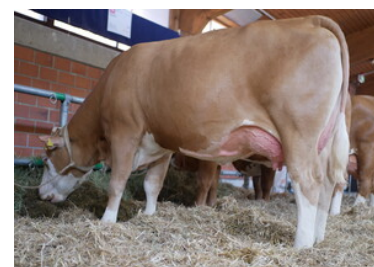
Hija de Hokuspokus, 1. lac.