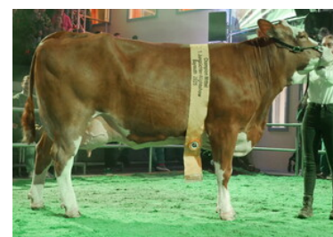
Hija de Herzpochen, 2. lac.