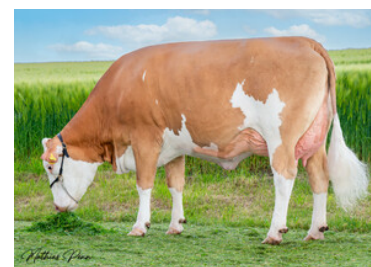
Hija de Hashtag, 1. lac.