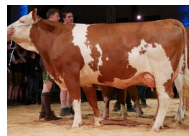
Hija de Hashtag, 1. lac.