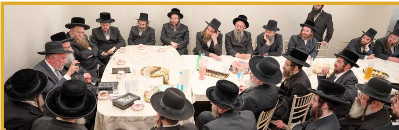
די וויכטיגע אסיפה פארגעקומען דורך קשר נפשי פאר פילע לאנדאנער רבנים, דיינים ומחנכים שליט"א