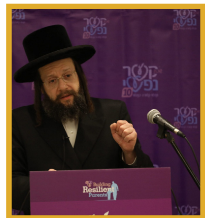
דעשער רב שליט"א אויפטרעטנדיג ביי איינע פון די קשר נפשי צוזאמקומען