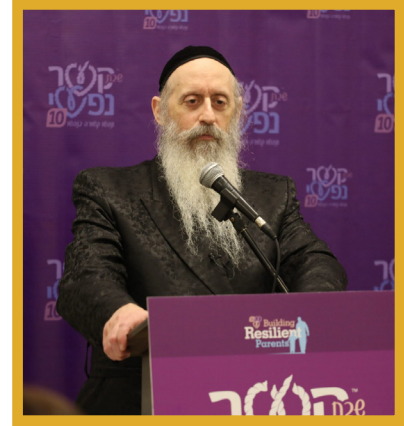
ראביי בן ציון טווערסקי שליט"א ביי איינע פון די קשר נפשי צוזאמקומען

- שרייבט דער תניא - דארף מען יענעם צוציען צו זיך 'בחבלי עבותות אהבה!' און ער ענדגט צו אז 'אפשר אזוי וועט מען אים קענען מקרב זיין צו תורה ומצוות. אבער אפילו אויב נישט האט מען כאטש פארדינט