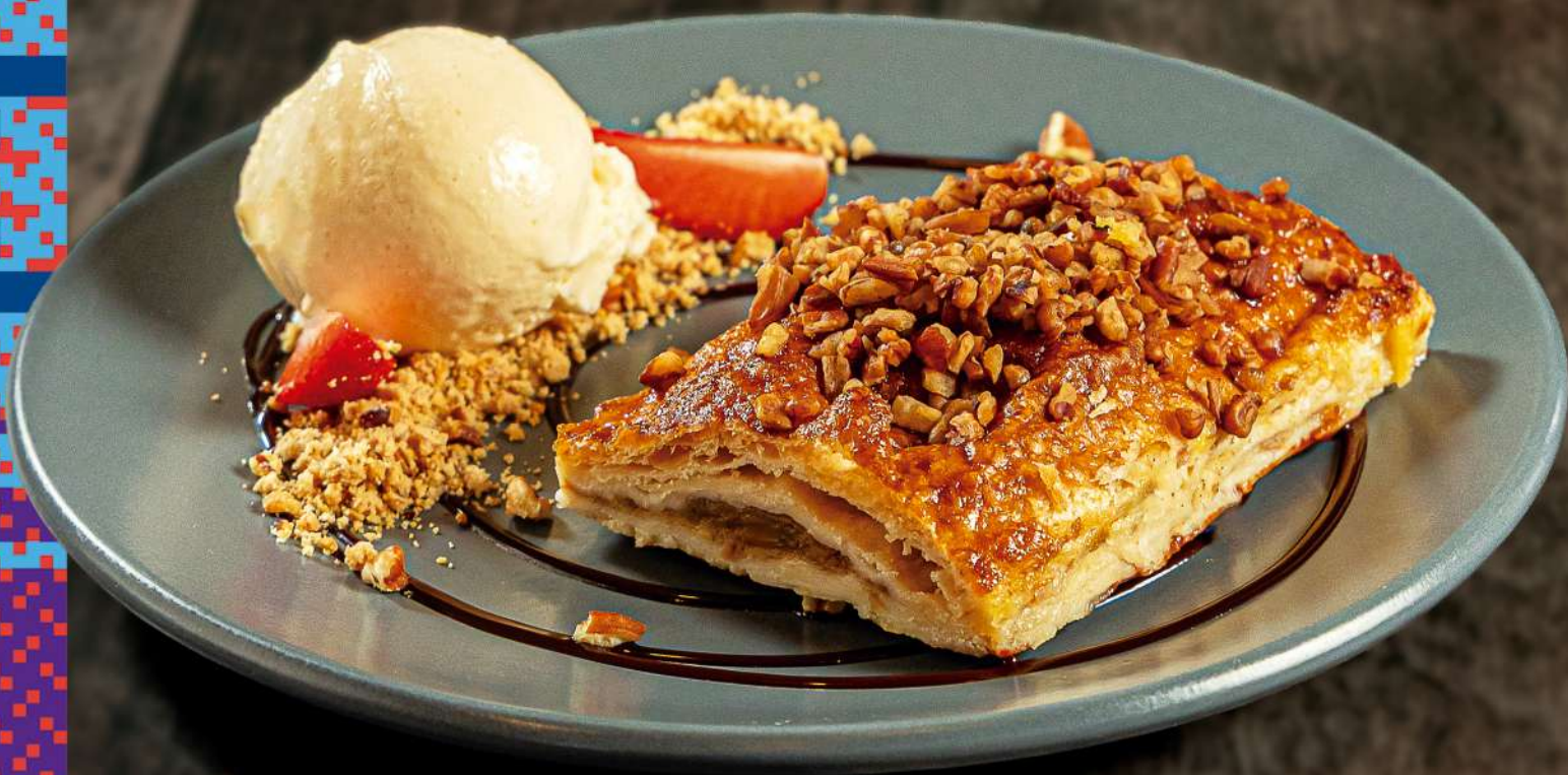
STRUDEL DE MANZANA