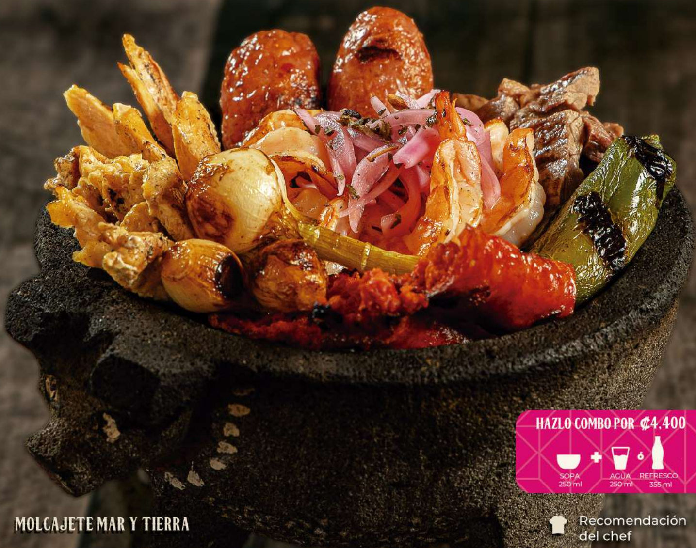
MOLCAJETE MAR Y TIERRA

Costillas de cerdo a la parrilla bañada en salsa bbq de la casa, acompañada de elote y papas fritas o papas salteadas.