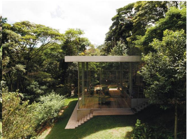
Vista lateral — concreto, vidro e mata. Foto: Gleeson Paulino