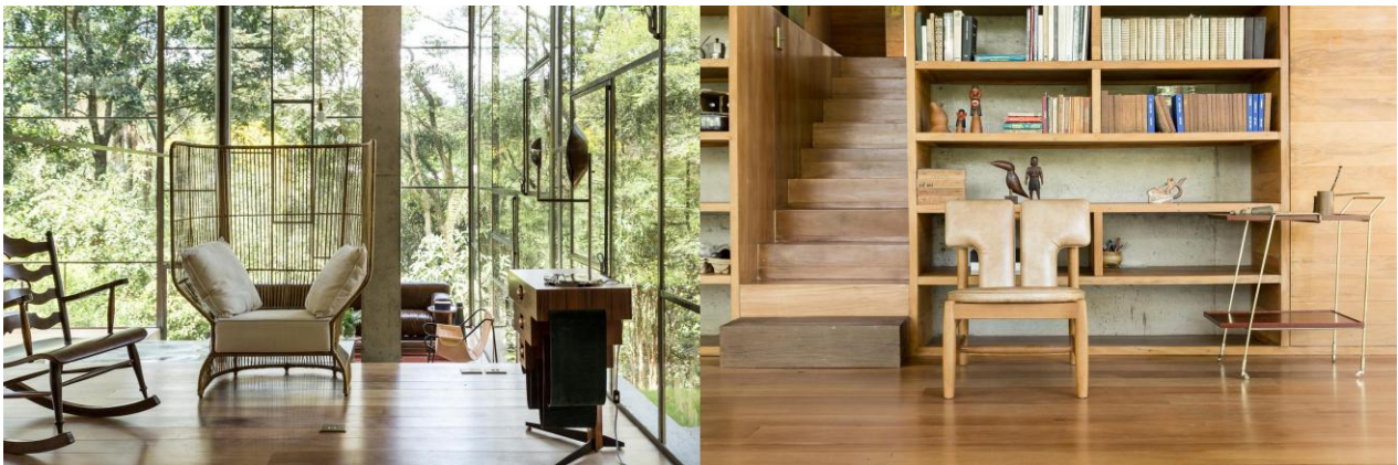
Mobiliário modernista brasileiro.