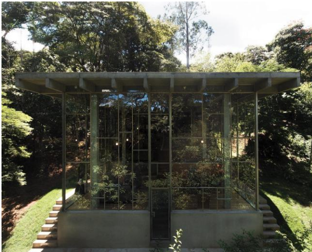
Fachada simétrica — esquadrias no estilo paulistana.

Os pisos, assim como o terraço superior, foram revestidos com tábuas longas e finas de madeira Garapeira, dispostas perpendicularmente ao eixo longitudinal do projeto. A volumetria é quase inteiramente envolvida por uma única fachada envidraçada, cujos perfis de ferro e motivos de design seguem a icônica tradição paulistana dos anos 1950.