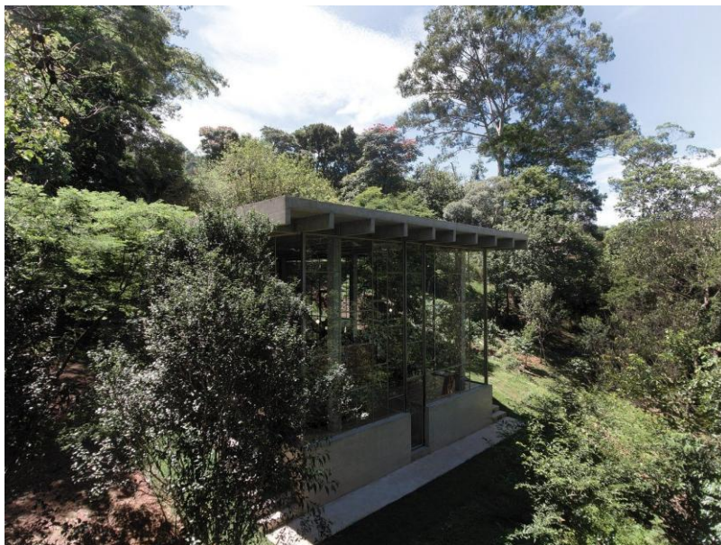
Vista aérea do terraço superior — madeira Garapeira sobre o volume de concreto.

O corpo de concreto da casa é coroado por um terraço superior em madeira Garapeira, envolvido por um espelho d'água perimetral que reflete o céu e as copas das árvores. É o elemento conceitual mais distintivo da obra: um pavimento elevado que coloca o morador em diálogo direto com a Mata Atlântica que cerca o terreno.