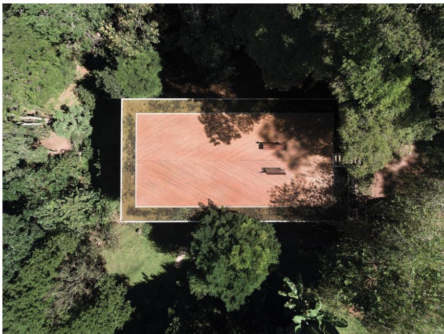
Vista aérea — a casa imersa no trecho preservado de Mata Atlântica do terreno.

— Atelier Branco, em depoimento para Dezeen