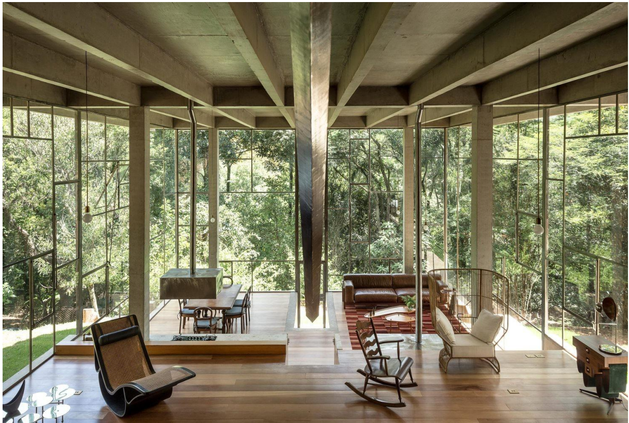
Living principal — estrutura de concreto aparente e fachada envidraçada.

No interior, a estrutura de concreto aparente define o caráter do espaço: vigas monumentais, pilares robustos e painéis de madeira que abrigam os livros. O mobiliário reúne ícones do design brasileiro — cadeiras de balanço em madeira, poltronas em palhinha, escrivaninhas modernistas — em diálogo com a vegetação que se revela por todos os ângulos das esquadrias de ferro.