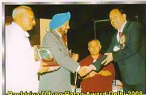
Rashtriya Udyog Ratan Award Delhi 2008