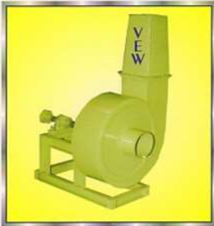
DUST COLLECTOR & REMOVER