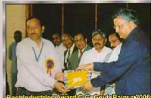
Best Industries Award C.G. Govt. Raipur 2006