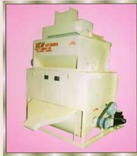
SCARIET MACHINE (ROLLER)