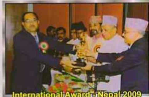
International Award - Nepal 2009