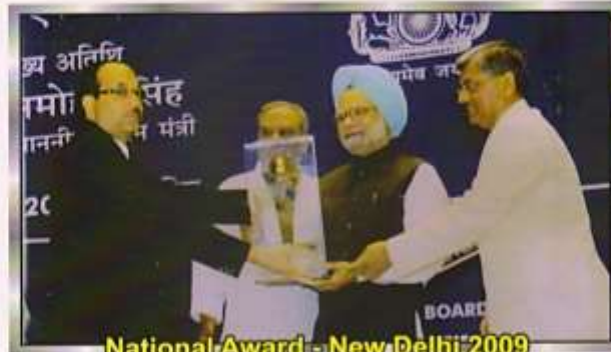
National Award - New Delhi 2009

Hon'ble Shri Dr. Manmohan Singh (Prime Minister of India)