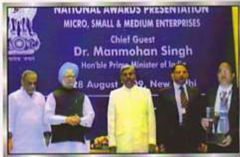
Chief Guest Dr. Manmohan Singh (Prime Minister of India)

Hon'ble Shri Dr. Manmohan Singh (Prime Minister of India)