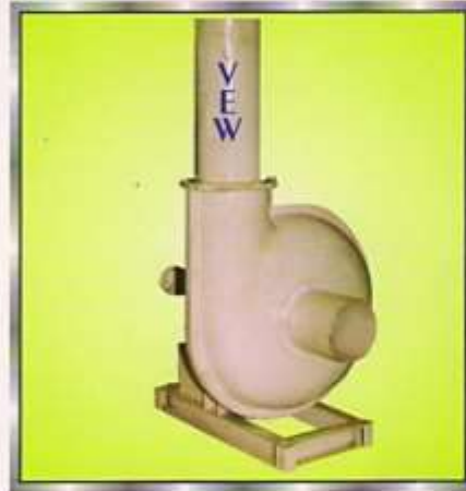
DUST COLLECTOR & REMOVER