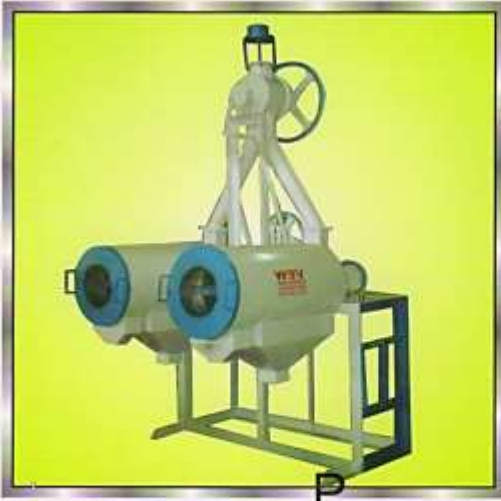
PLANT SHIFTER FILTER MACHINE