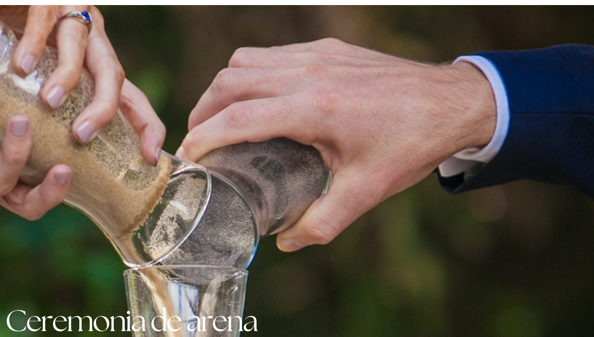
Ceremonia de arena