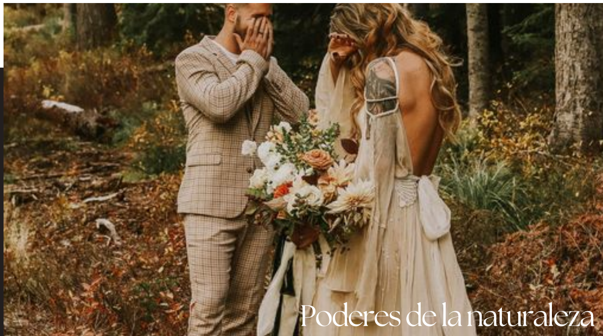
Poderes de la naturaleza