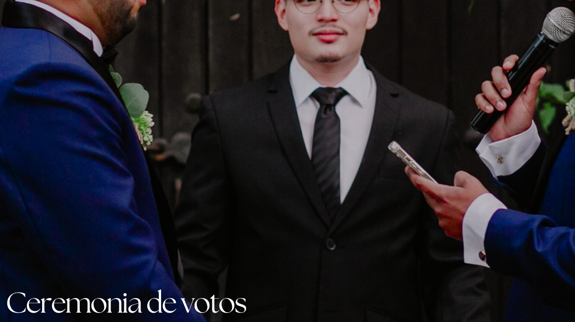
Ceremonia de votos