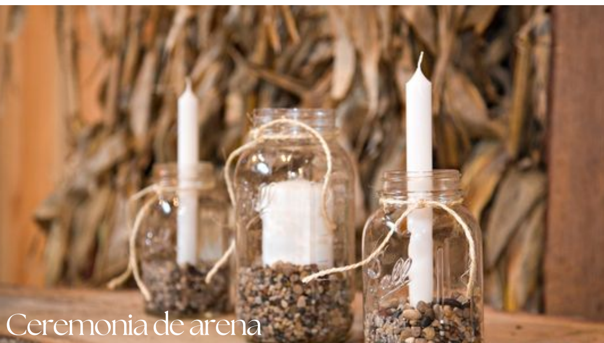
Ceremonia de arena