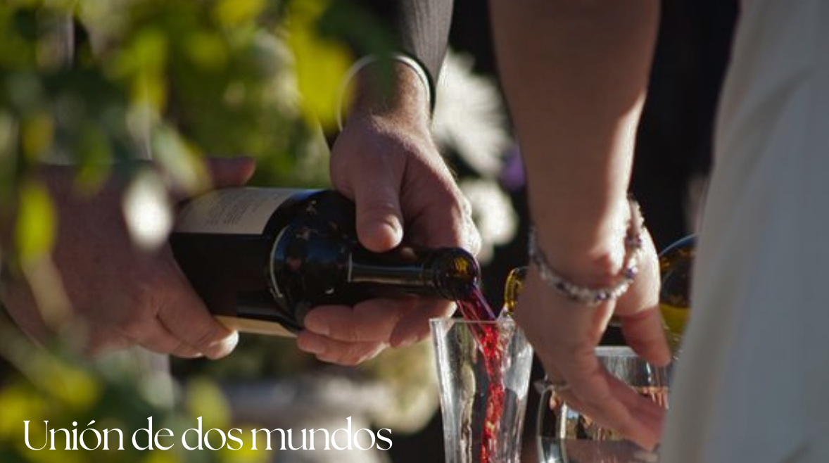
Unión de dos mundos