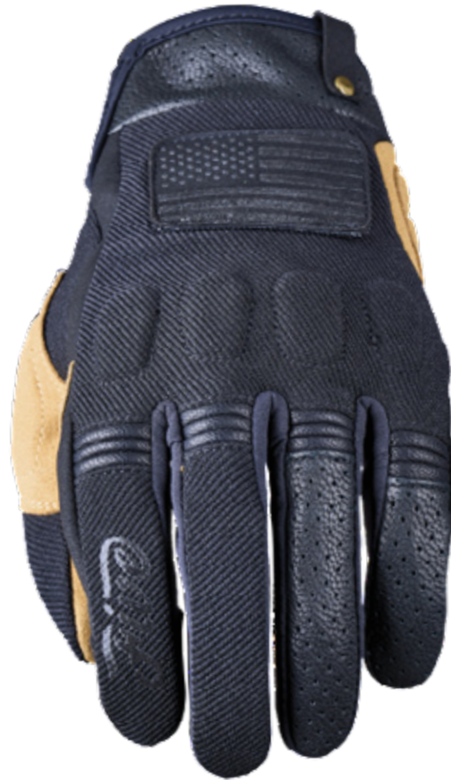
Black / Tan