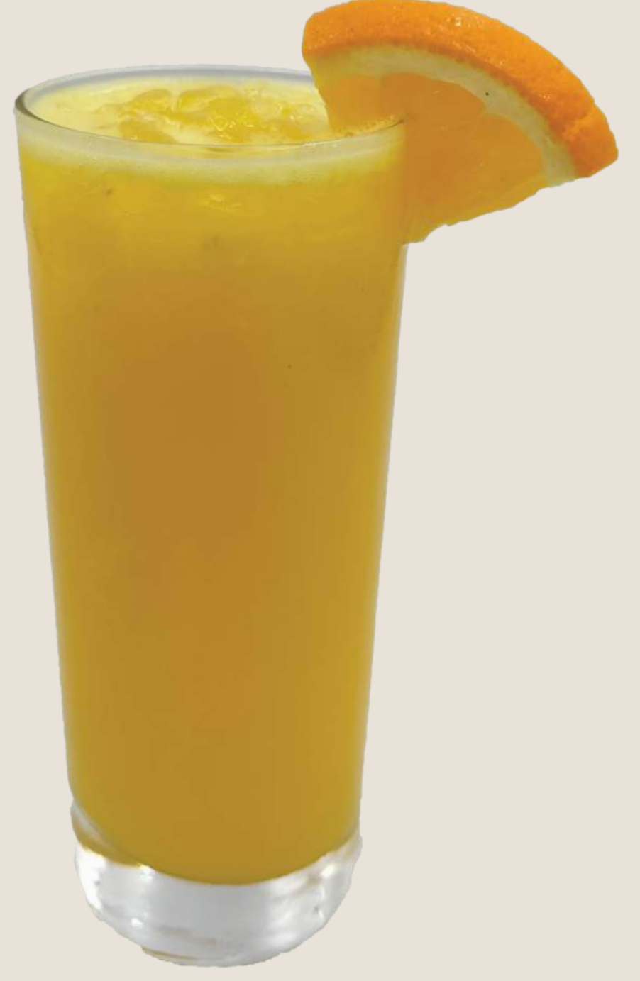
عصير برتقال طازج.....20 درهم