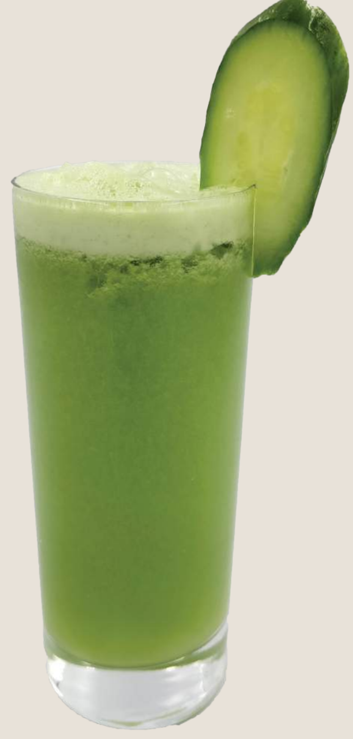
عصير الخيار ، الكرفس والتفاح الأخضر.....14 درهم