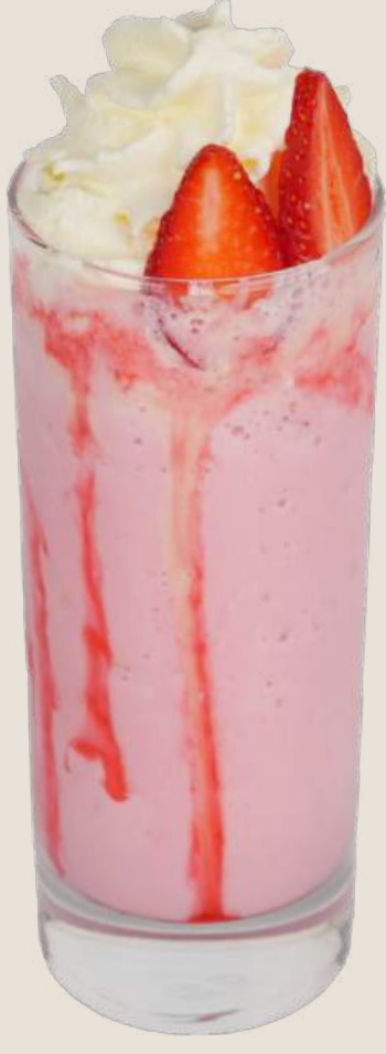
ميلك شيك الفراولة.....18 درهم