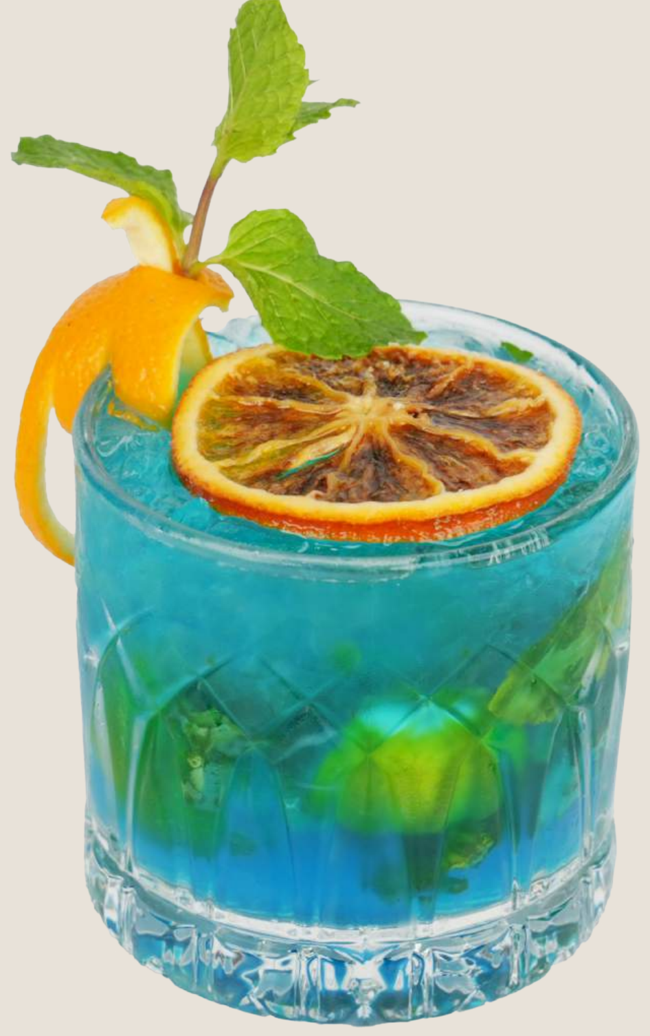
موهيتو الازرق.....19 درهم