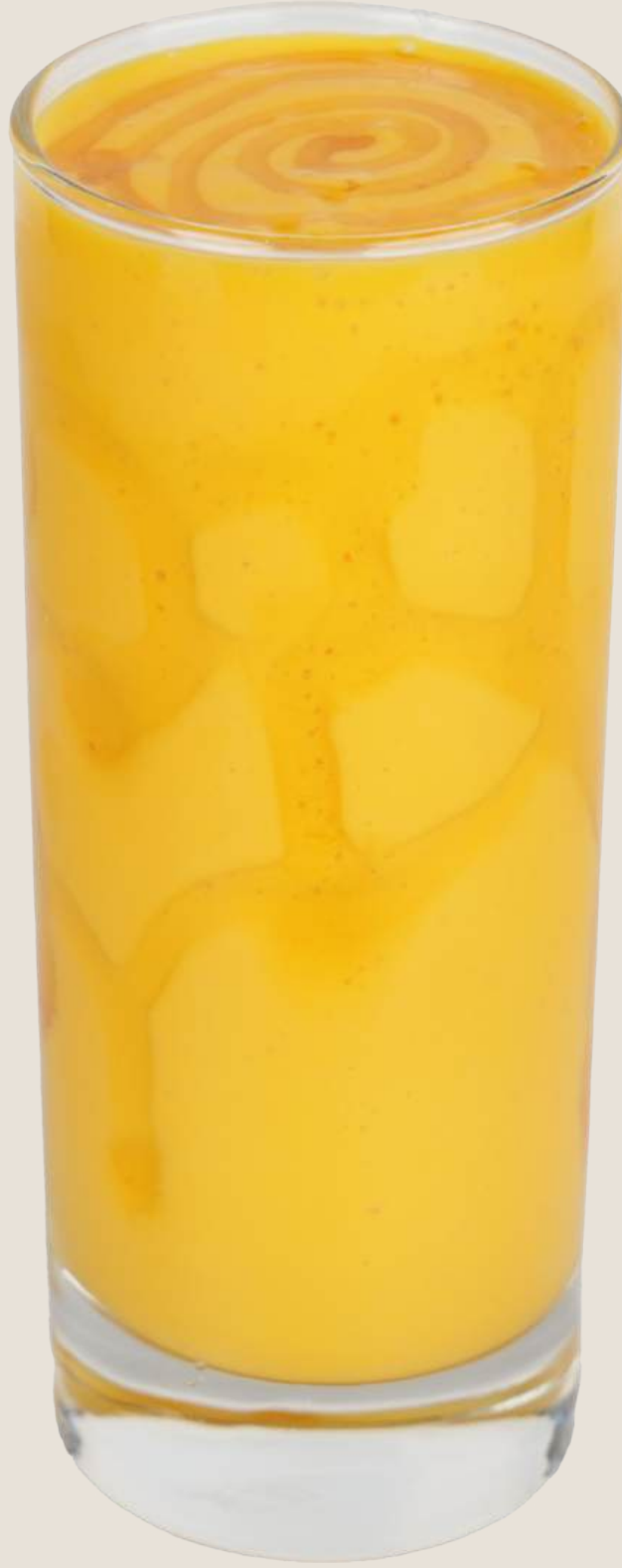
مانجو لاسيه.....20 درهم