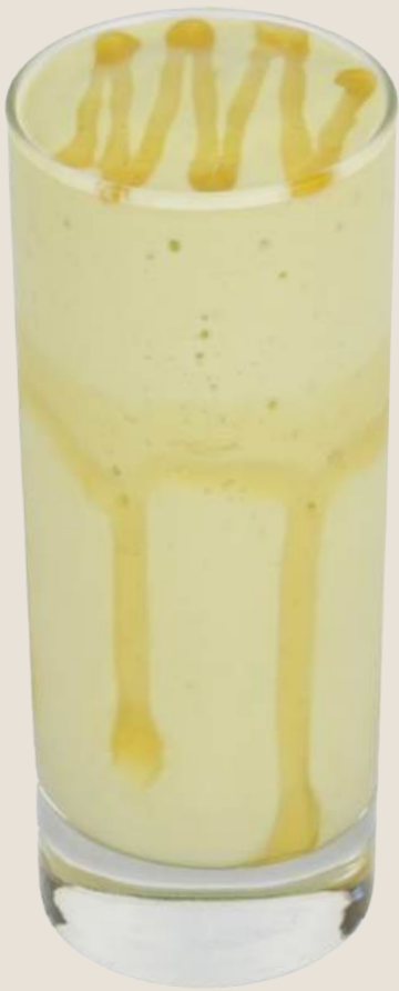
ميلك شيك الأفوكادو.....15 درهم