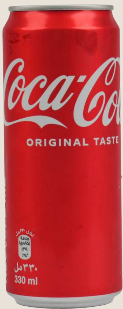
كوكا كولا.....6 درهم