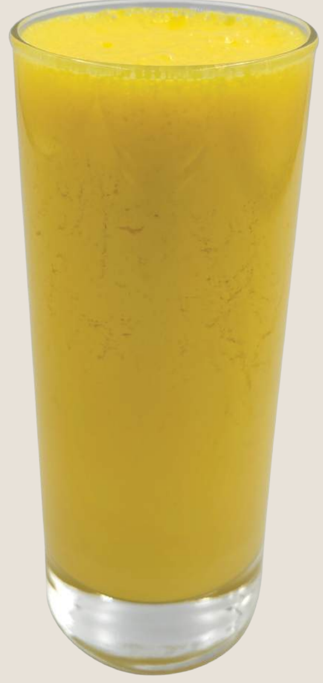
سموزي المانجو.....20 درهم