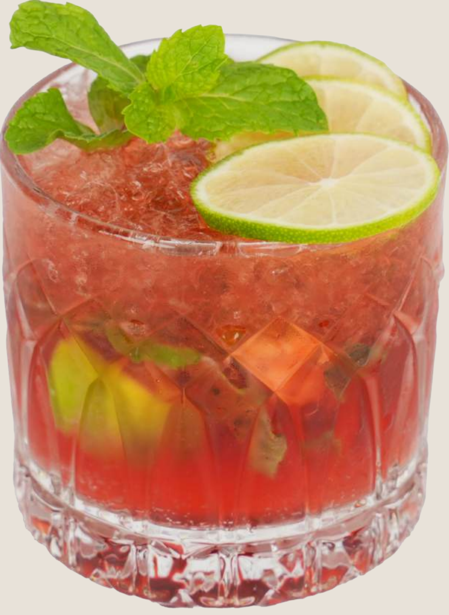
موهيتو فراولة.....19 درهم