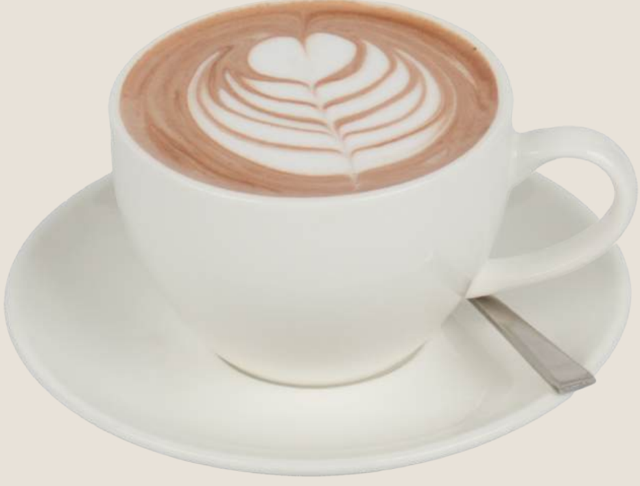
الشوكولاته الساخنة.....18 درهم