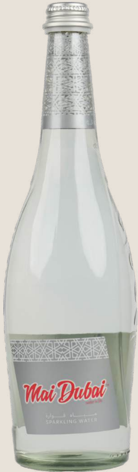
ماي دبي مياه غازية 750 مل.....12 درهم