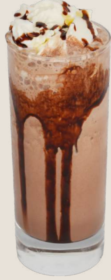
ميلك شيك الشوكولاته.....18 درهم