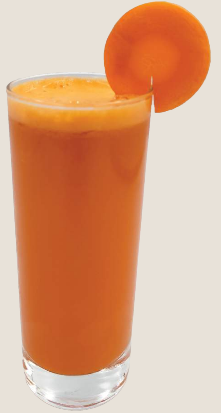
عصير جزر طازج.....15 درهم