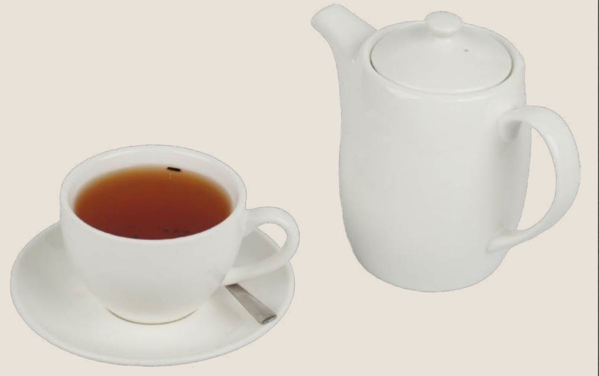
شاي أسود (إرل غري).....5 درهم