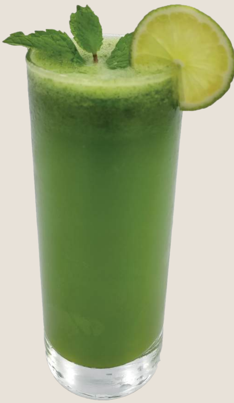
عصير ليمون نعناع طازج.....14 درهم