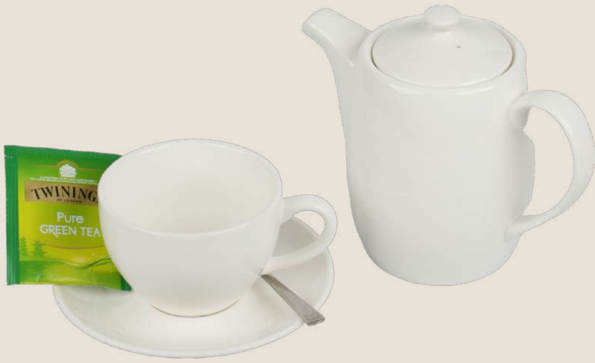
شاي أخضر.....5 درهم