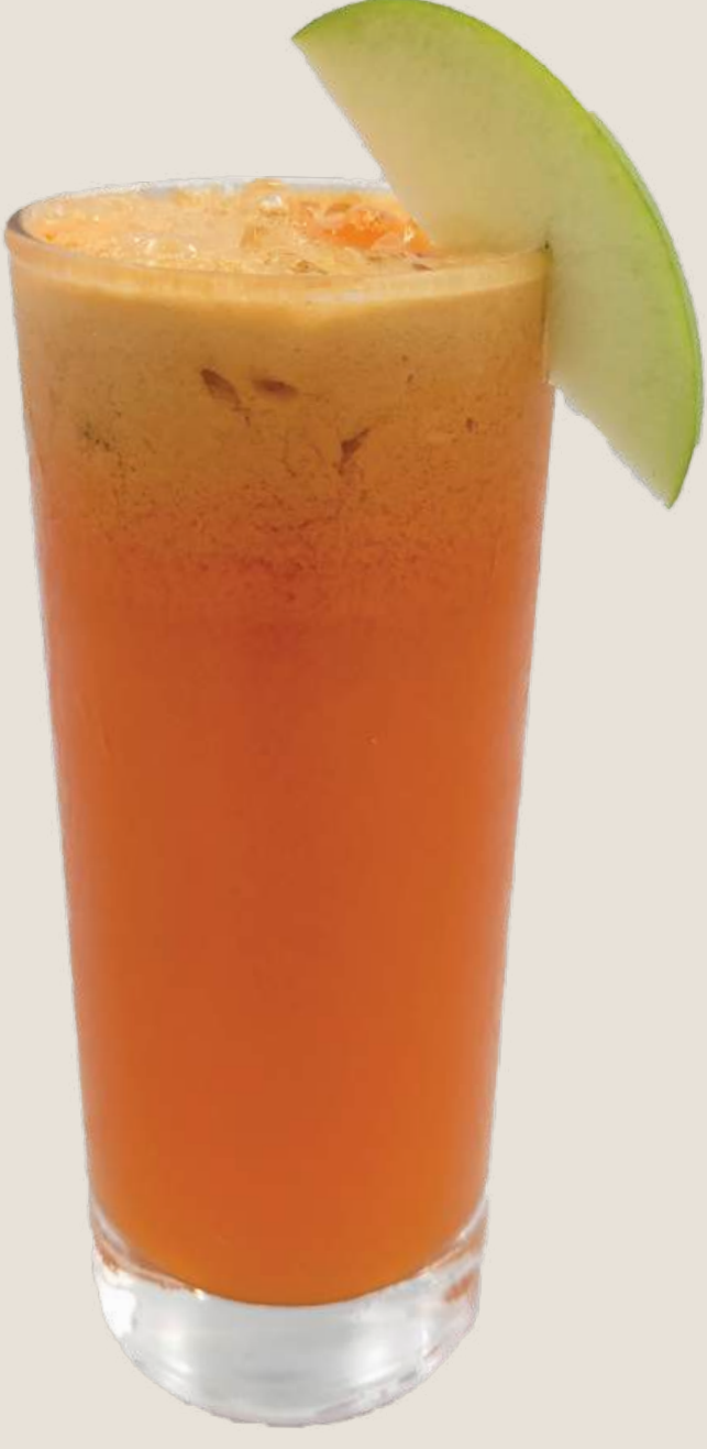
عصير الجزر ، التفاح والزنجبيل.....14 درهم