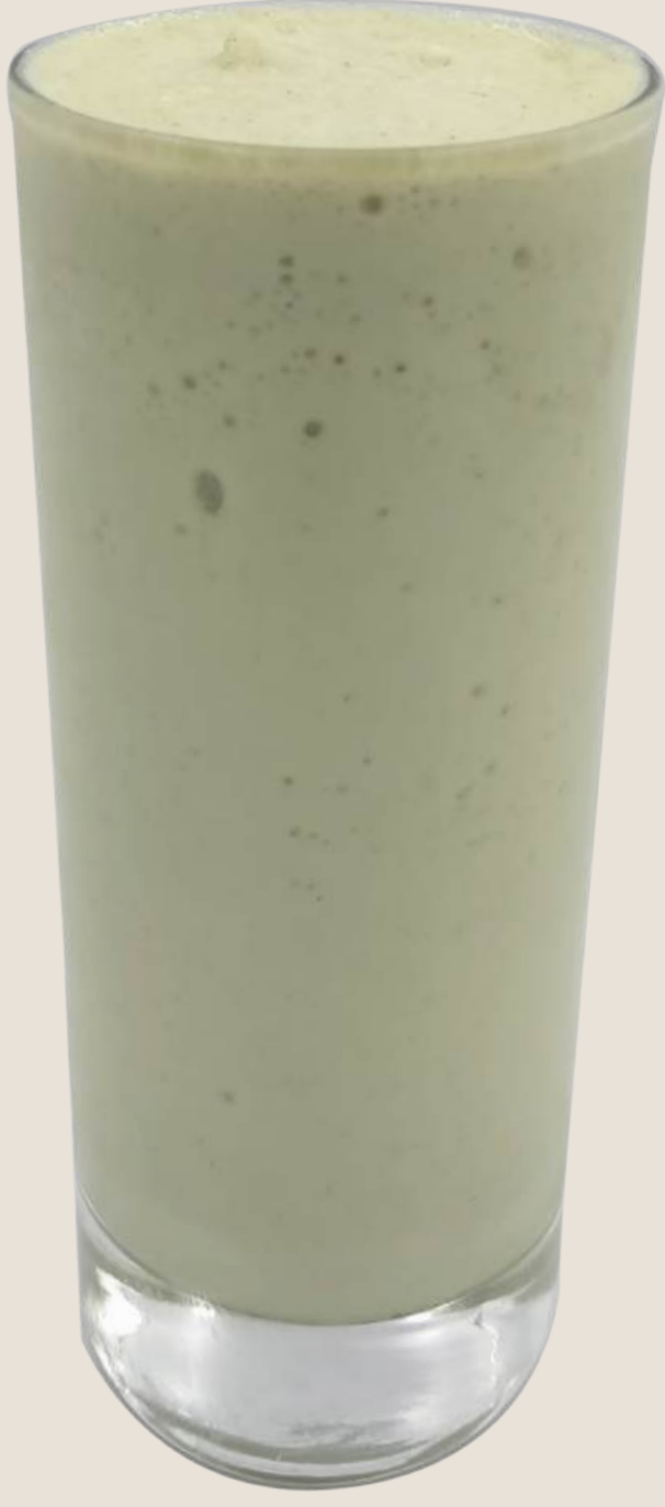
سموزي الفستق.....31 درهم