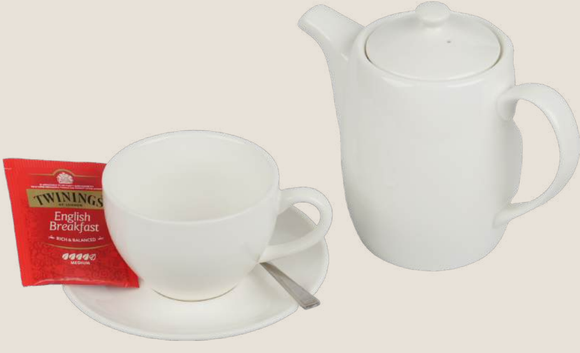
شاي أسود.....5 درهم