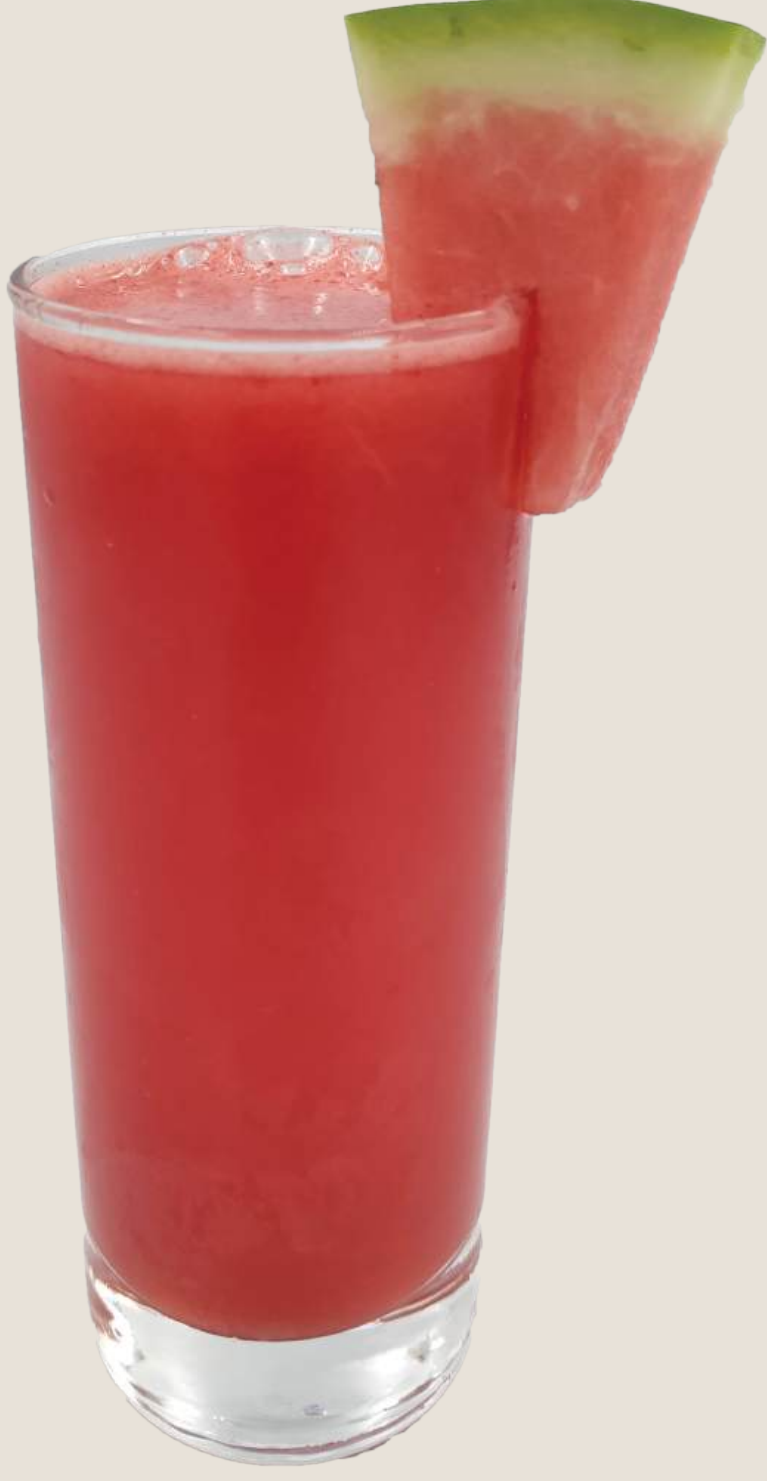
عصير بطيخ طازج.....12 درهم