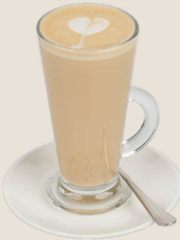
لاتيه كوفي.....18 درهم