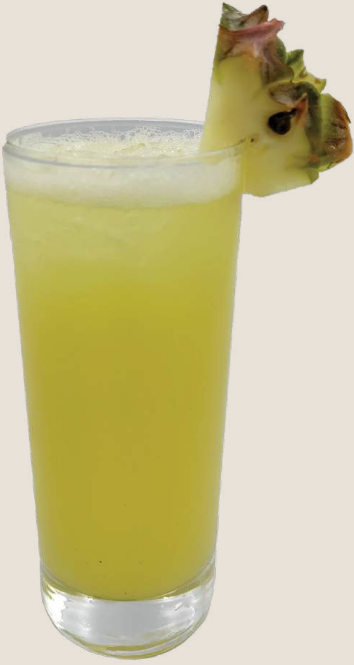
عصير أناناس طازج.....16 درهم