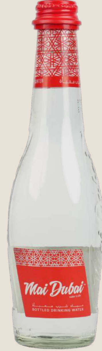
ماي دبي مياه عادية 330 مل.....5 درهم