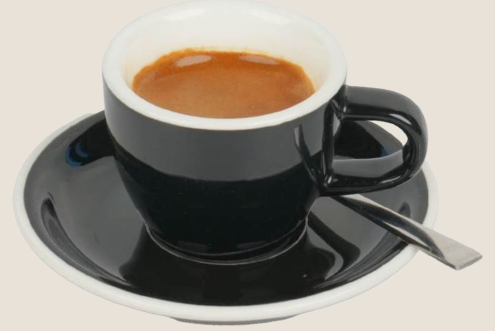
دبل اسبريسو.....15 درهم