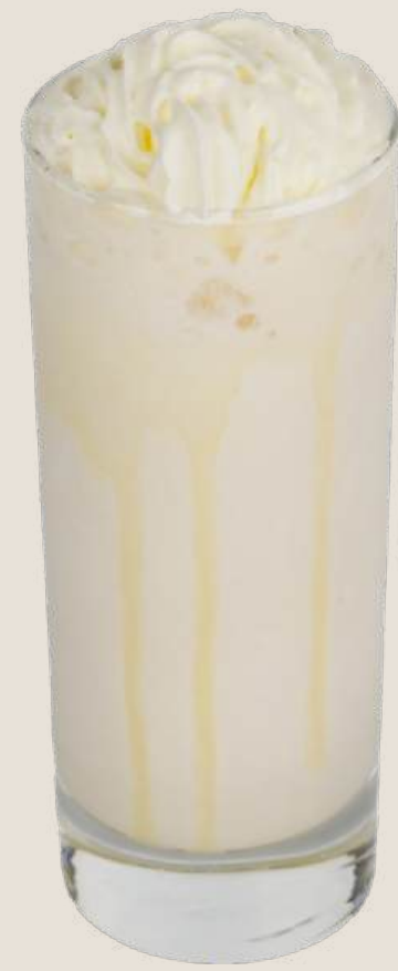
ميلك شيك الموز.....15 درهم