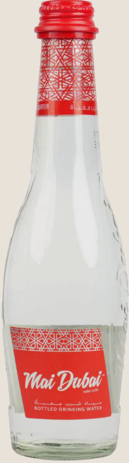
ماي دبي مياه عادية 750 مل.....10 درهم