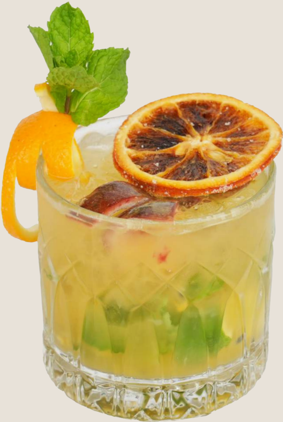
موهيتو باشن فروت.....22 درهم