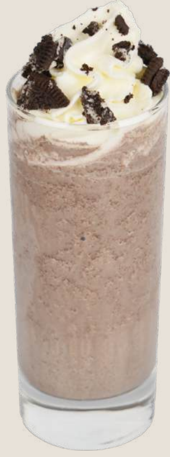
ميلك شيك الأوريو.....20 درهم