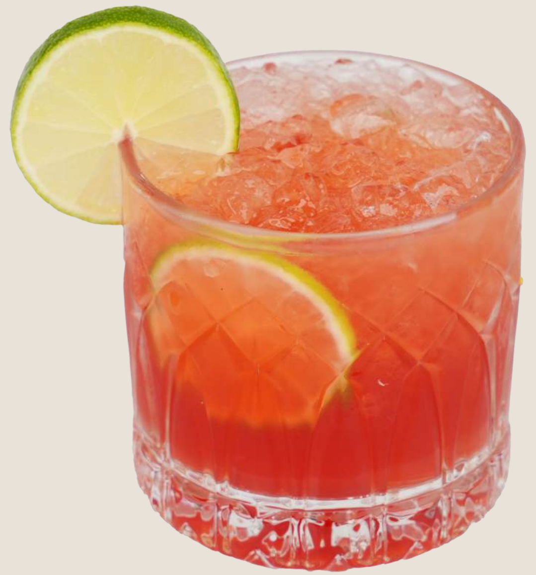
موهيتو الوردى.....19 درهم