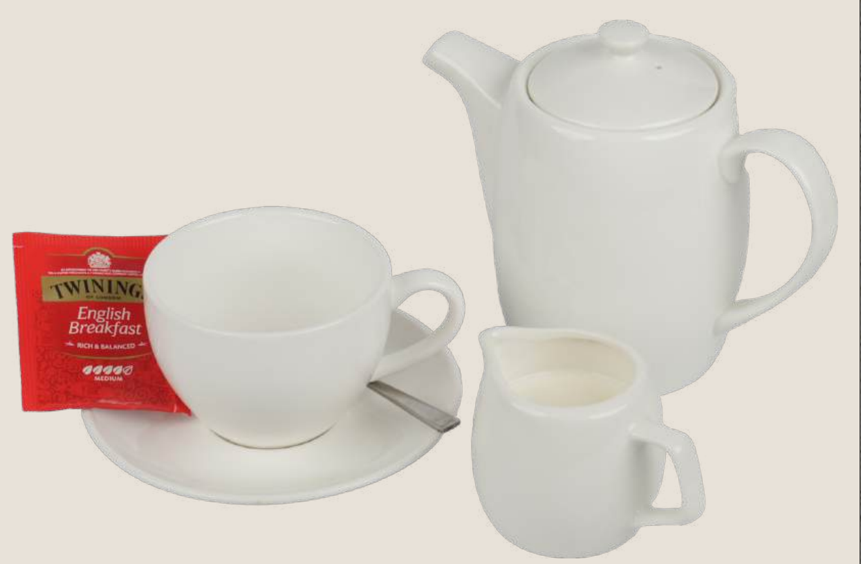
شاي مع حليب.....5 درهم