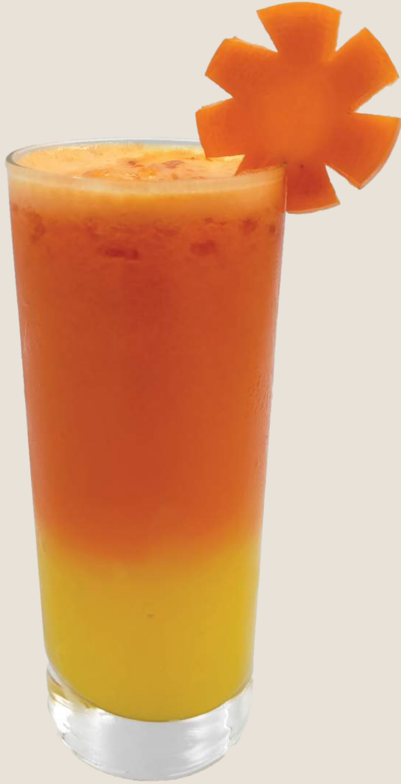
عصير البرتقال ، الجزر والزنجبيل.....14 درهم