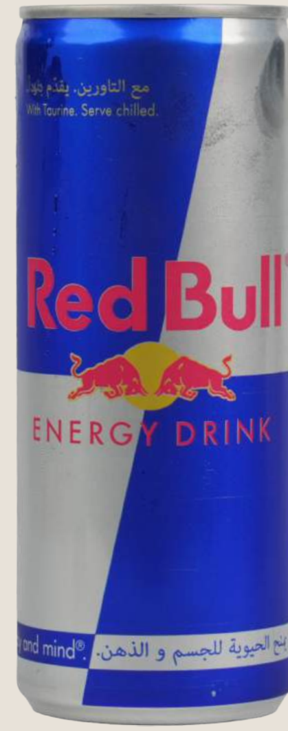
ريد بول.....18 درهم