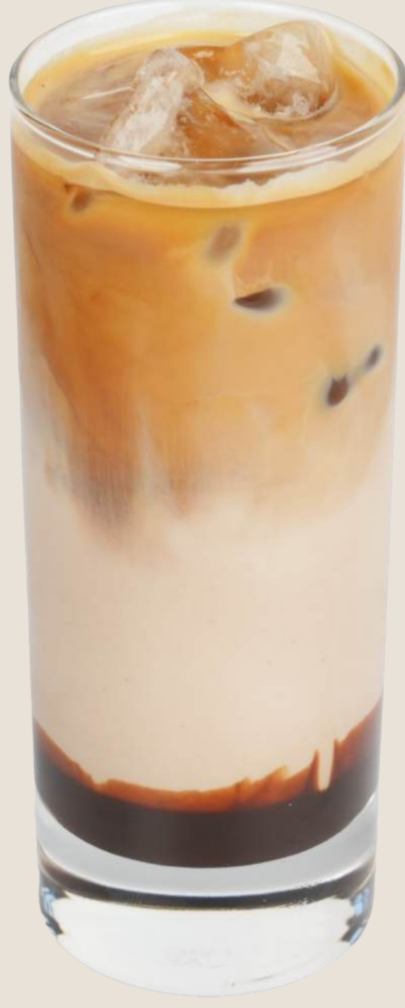
موكا بارد..... 19 درهم