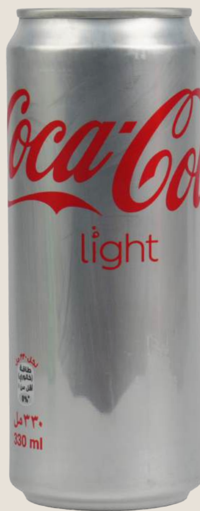
دايت كوكا كولا.....6 درهم