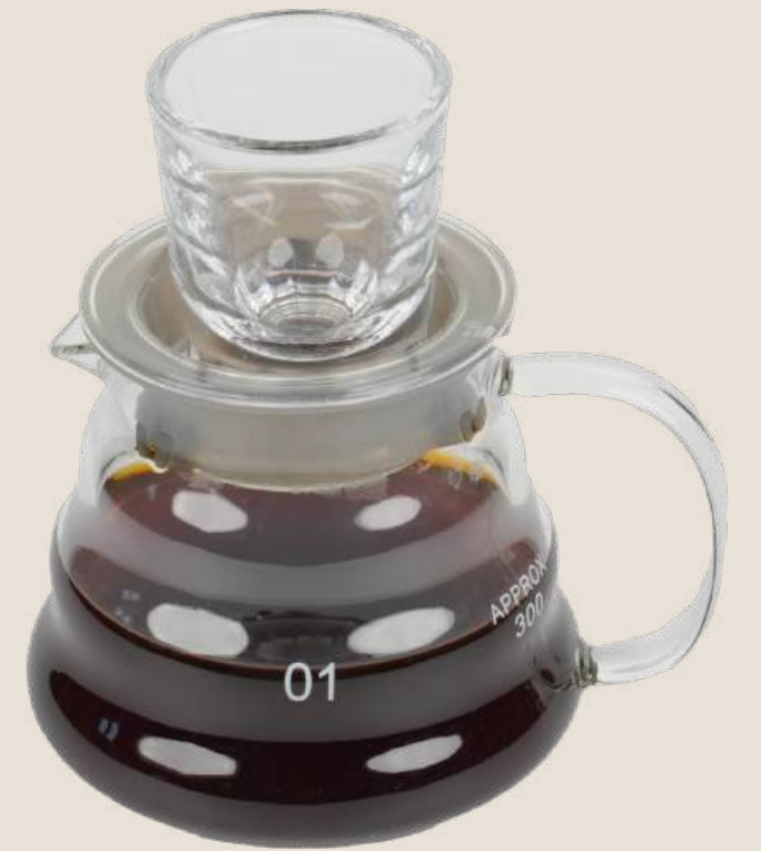
قهوة في 60 المختصة.....18.99 درهم