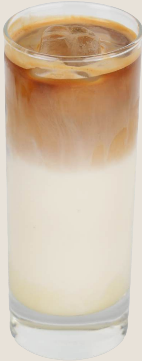
سبانش لاتيه بارد..... 22 درهم