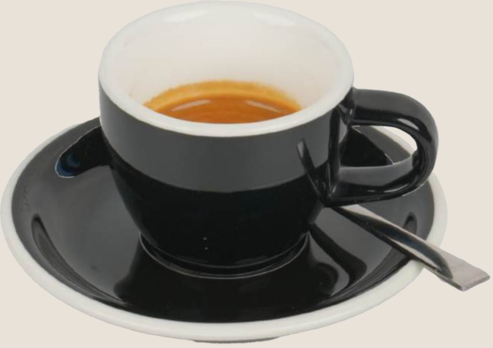
سنجل اسبريسو.....12 درهم