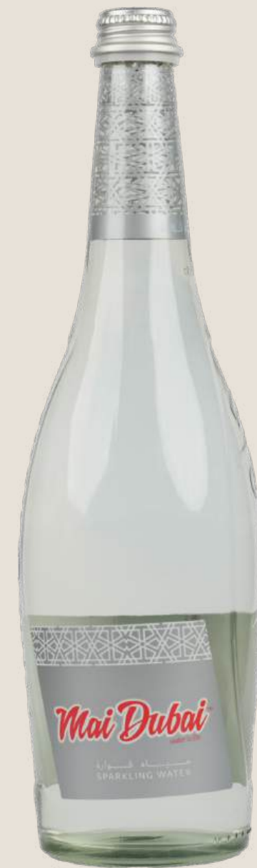
ماي دبي مياه غازية 330 مل.....6 درهم