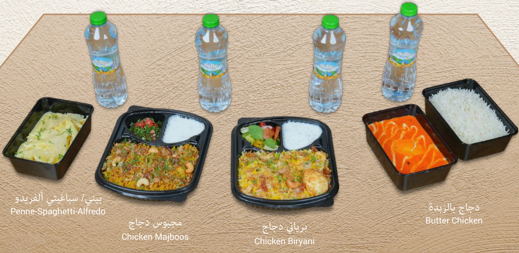
بيني / سباغيتي ألفريديو Penne-Spaghetti-Alfredo