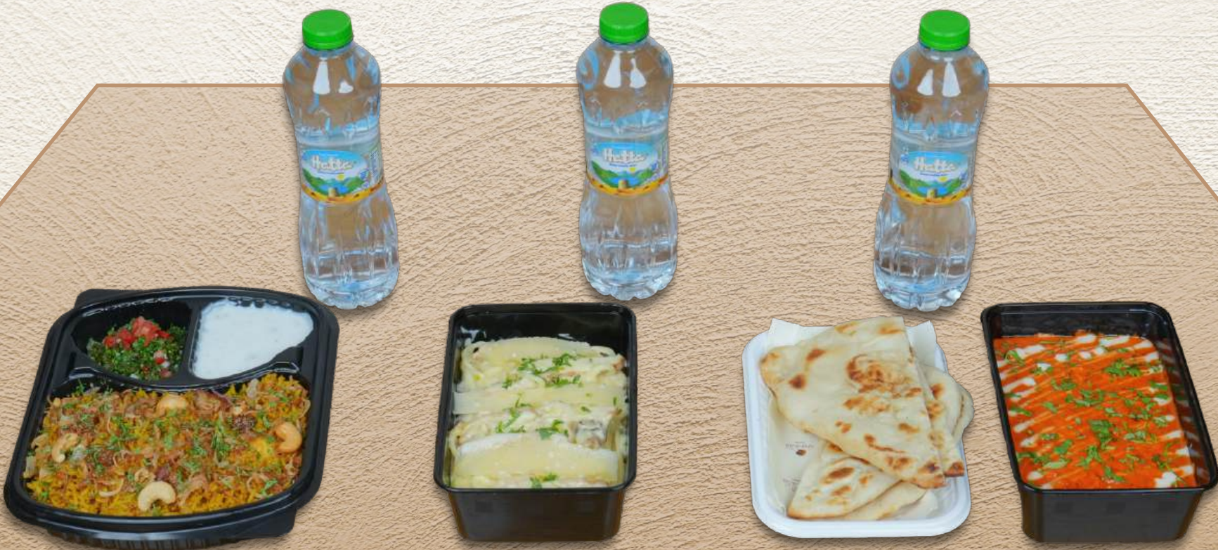
مجبوس دجاج Chicken Majboos