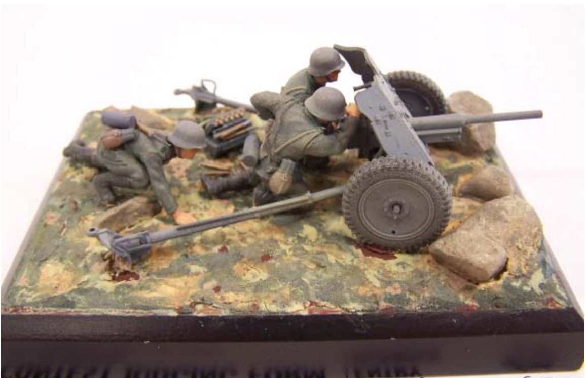
ROCON 27 September 2006

Technically speaking, this is not a diorama, just a crew operating their weapon with no real story going on. I like to keep things informal, so this is where I put it at least for now.