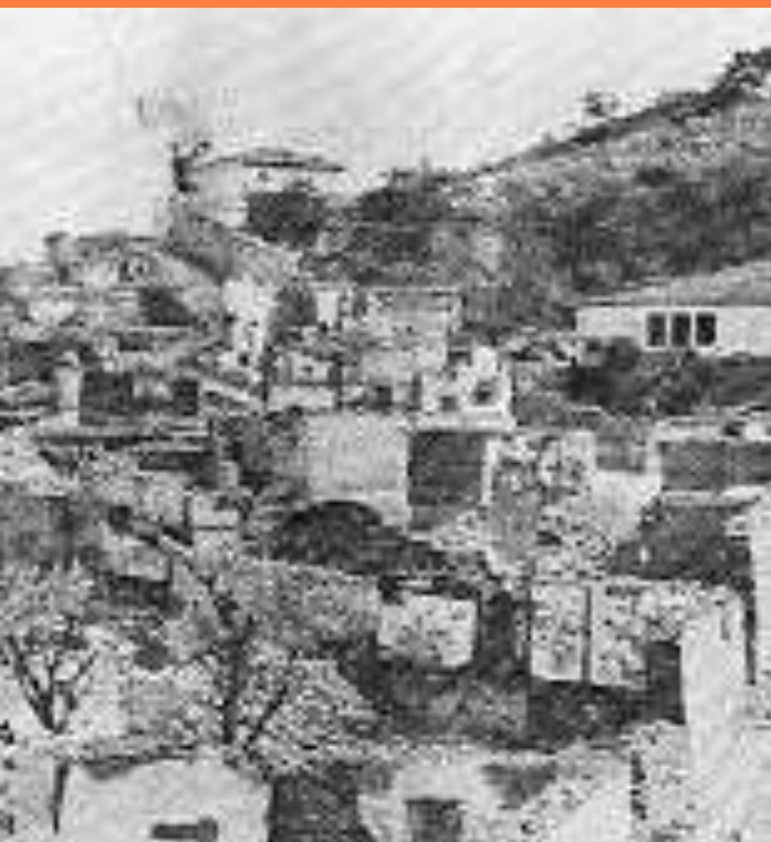
Струмица после опожарувањето 1913 година

Пред Балканските војни, Струмица била град од околу 20,000 жители, а после нив бројот на население изнесувал околу 10,000 жители