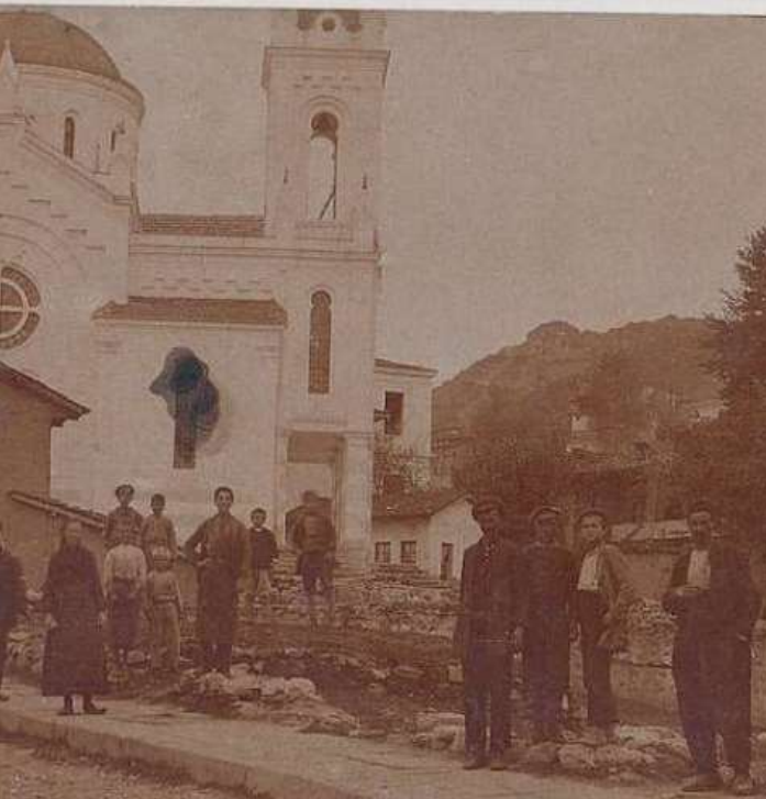
Струмица во период на Балканските Војни

никој не може да биде осуден на смрт или егзекутиран