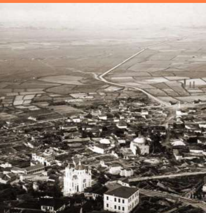
Слика од Струмица во период на Балканските Војни

Омраза на расна и верска основа, одмазда и алчност предизвикале спирала на големи страдања во Струмица во 1912 година Злосторствата сторени од една страна, предизвикале уште поголеми злосторства од противниците