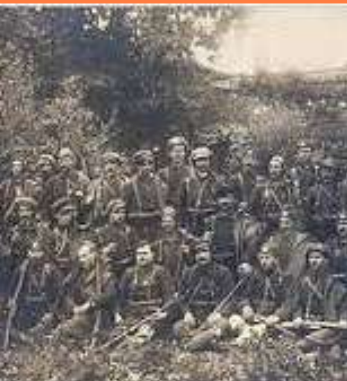
Струмичка чета на ВМРО

Во 1919 година Струмица од град со 9,000 жители изгубил околу 3,000 жители кои се иселиле од градот поради промена на власта