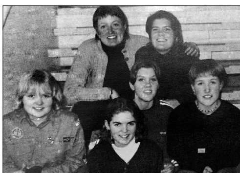
STOR JOBB: Speidarane i Stryn gjer ein stor jobb med å førebu speidarkongressen.