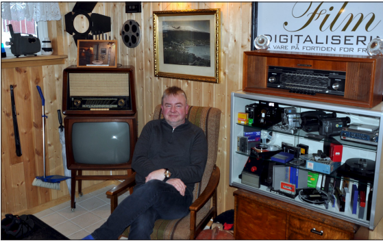
I GODSTOLEN: Det kan vere godt med ein liten pause i det som er starten på museumsdelen.