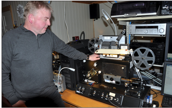
GAMLEMASKINA: Dette er maskina som har gjort arbeidet med 8 mm film til no, men som går over i museumsdelen.