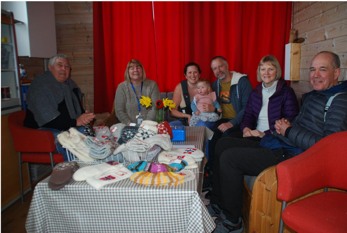
Pause: Turistane kosar seg i sofabenken i vevstova.