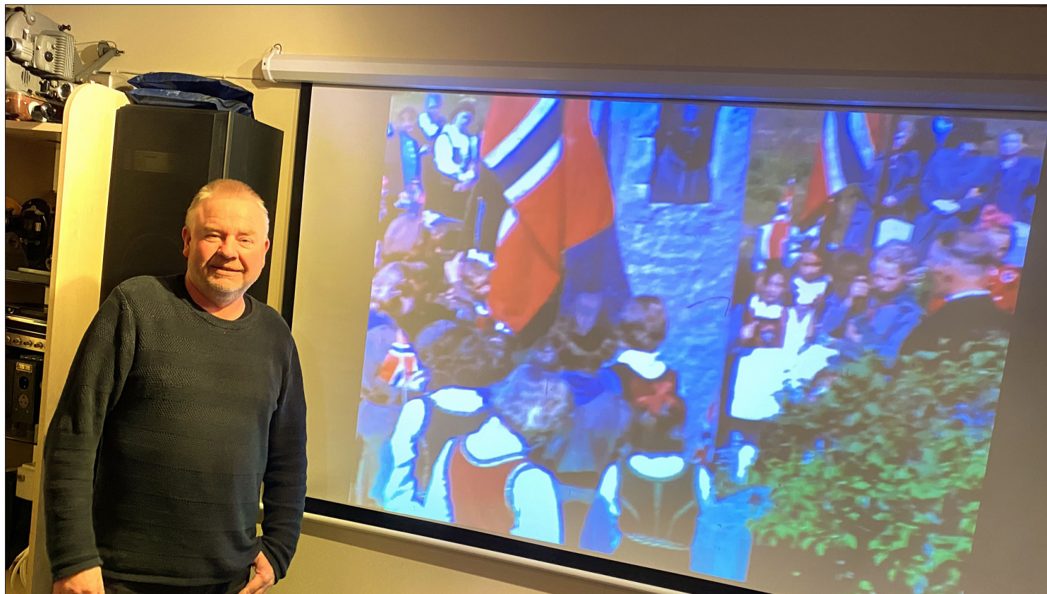
STORFILM: Innvikfilmen er klar for premiere i Heimlund 17. mai.

●● Innvikfilmen er langt på veg sett saman av nettopp dette: Filmsnuttar henta ut frå gamle filmar folk har hatt liggande, eller funne når dei rydda opp i gamle hus. Kast aldri slikt. Der er alltid historie å finne