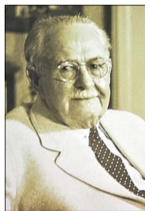
Store gåver: Singer kom med rause gåver til bygging av Aldaheim.