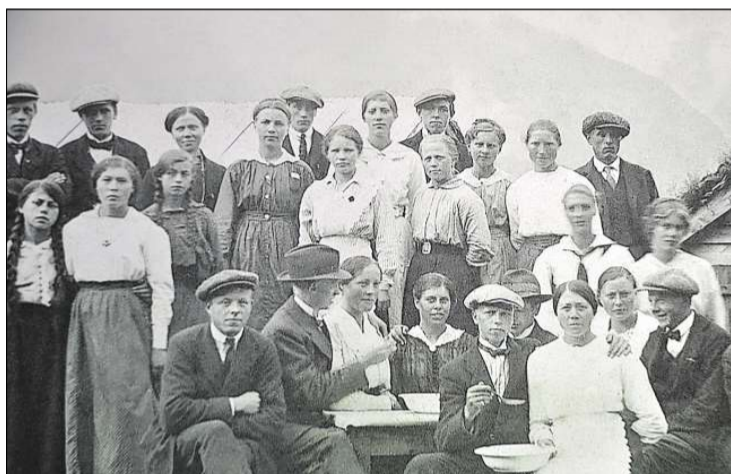
Sæterliv: Det var mykje ungdom samla på sætrane i gamle dagar.