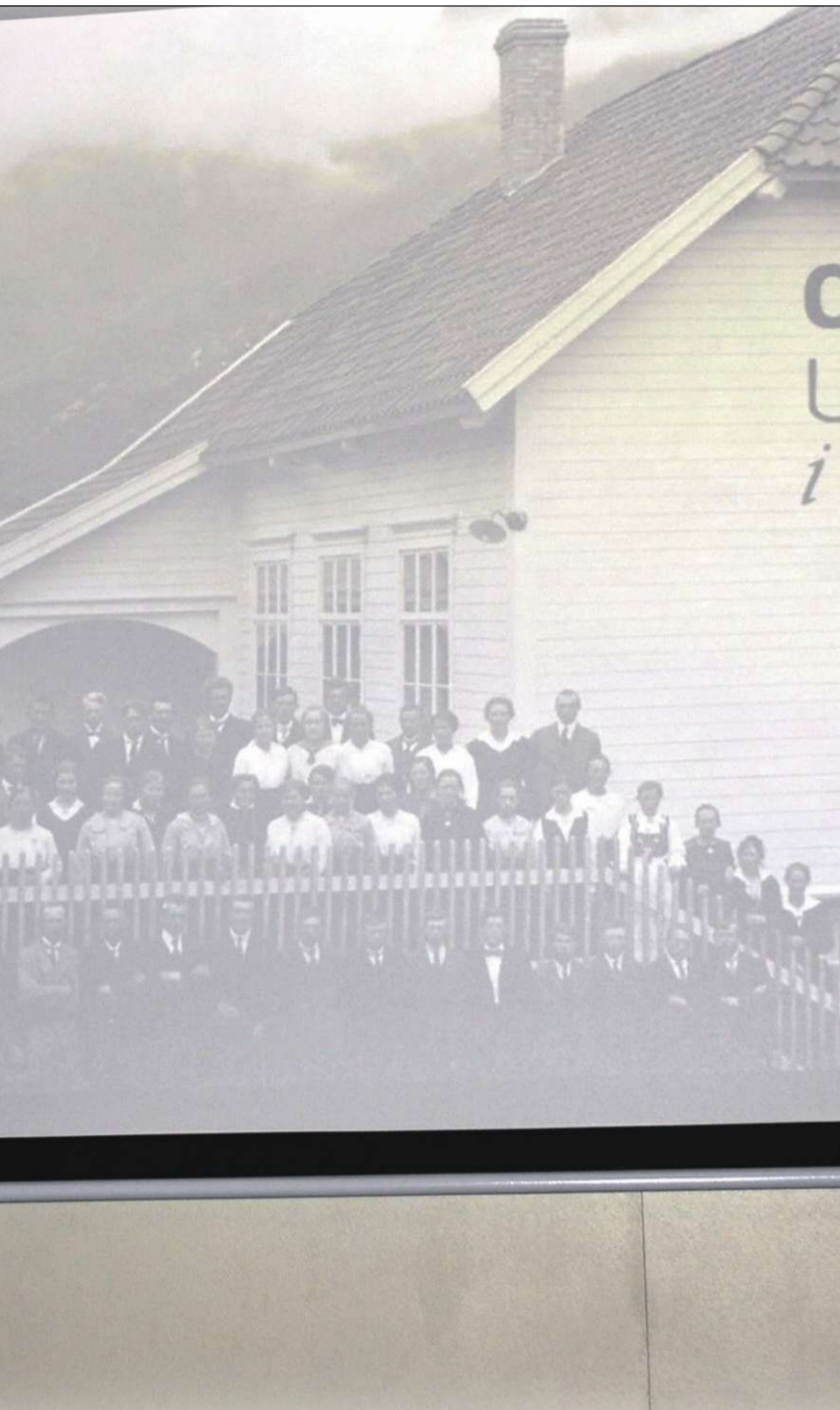
est i Aldaheim laurdag 19. november.