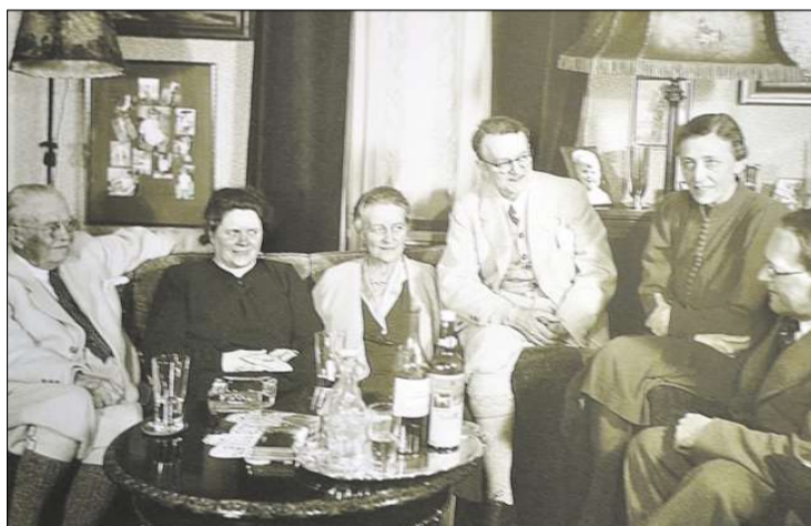
Store gaver: Singer kom med rause gaver til bygging av Aldaheim.