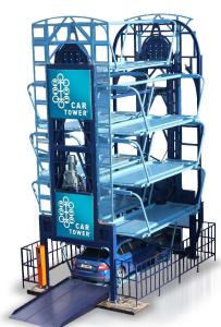
Åben CT 6 L

CAR TOWER er et vertikalt roterende parkeringssystem hvor bilen køres ind på en platform i bunden. CAR TOWER er en industrielt præfabrikeret maskinstruktion med et minimumstidsforbrug ved fabrikation, opstilling og indkøring.