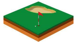
Stier på golfbaner Kantsikring i bunkers Bundsikring i bunkers