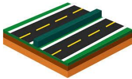
Motorveje Midterrabatter Yderrabatter