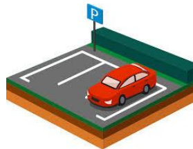
Parkeringspladser Åbne pladser