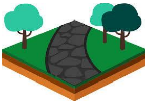
Stier i parker og haver Bede omkring træer