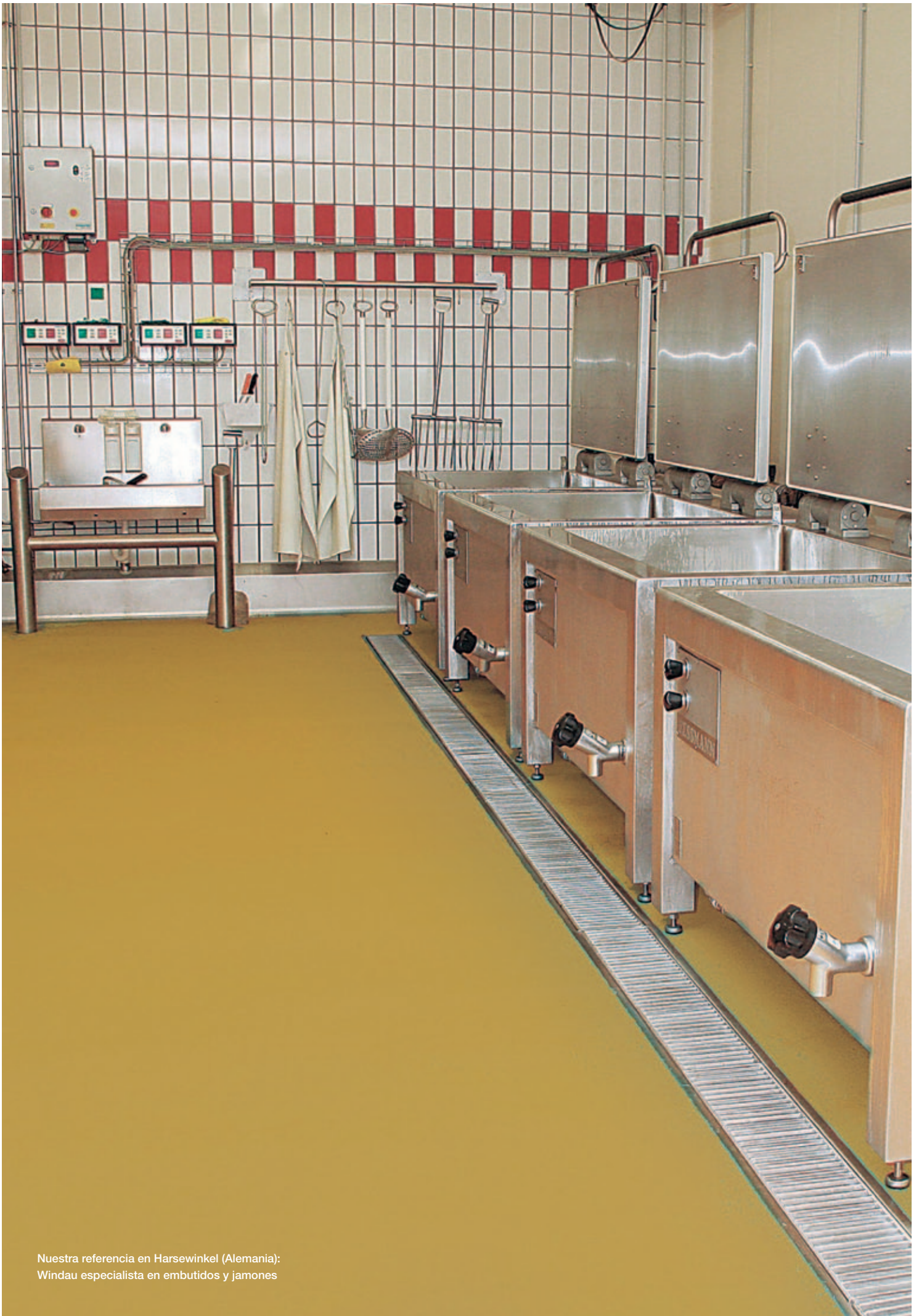
Nuestra referencia en Harsewinkel (Alemania): Windau especialista en embutidos y jamones