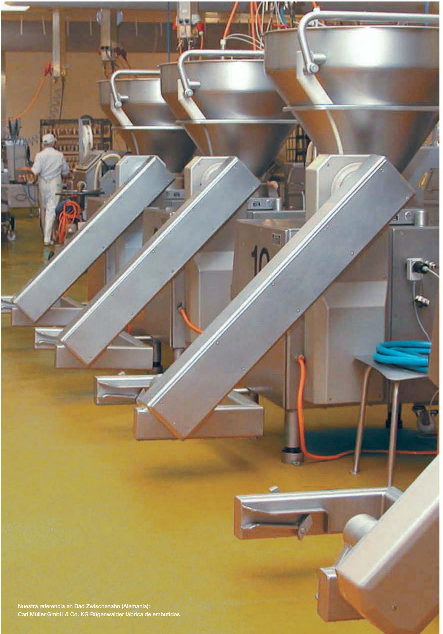
Nuestra referencia en Bad Zwischenahn (Alemania): Carl Müller GmbH & Co. KG Rügenwalder fábrica de embutidos