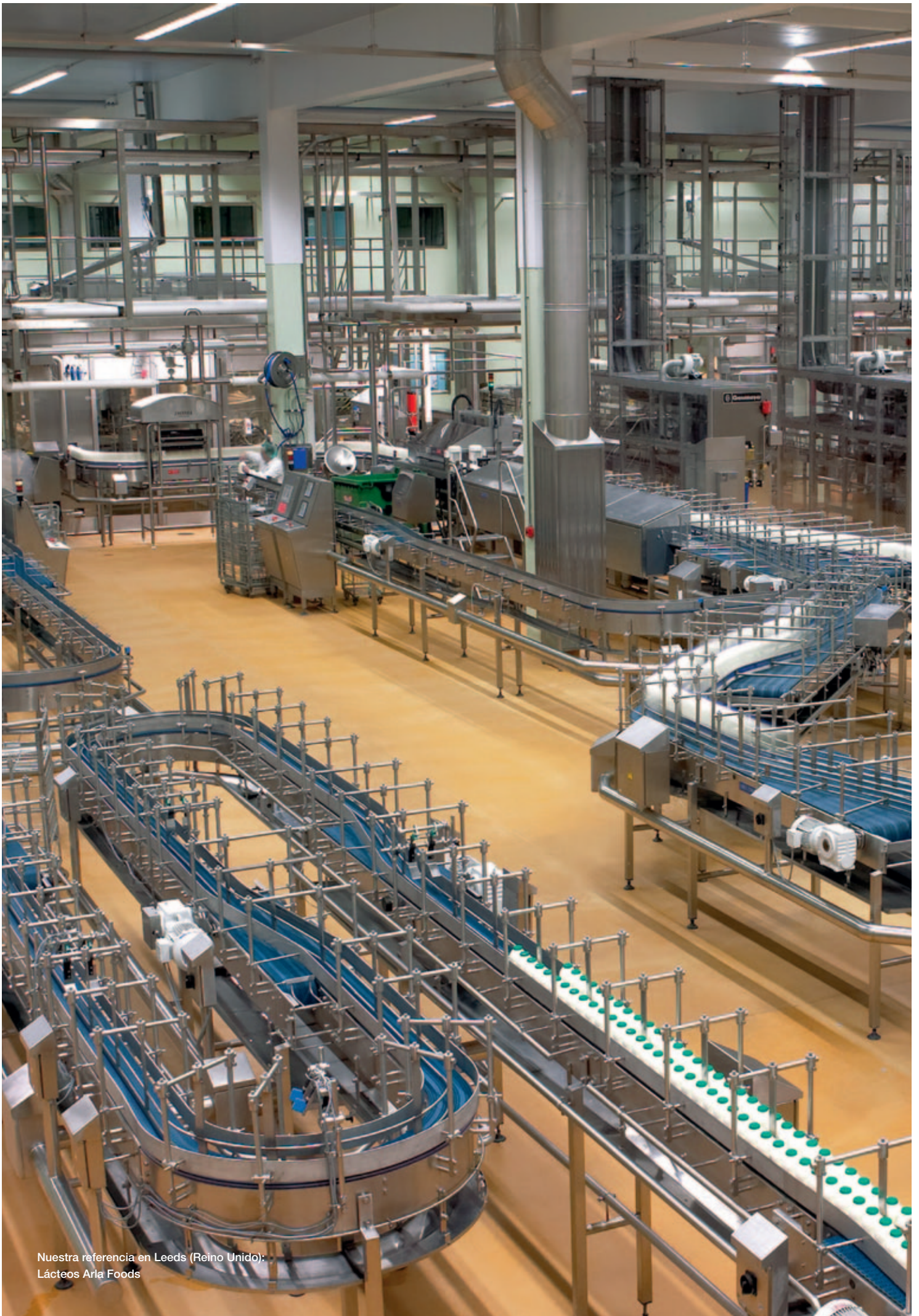
Nuestra referencia en Leeds (Reino Unido): Lácteos Arla Foods