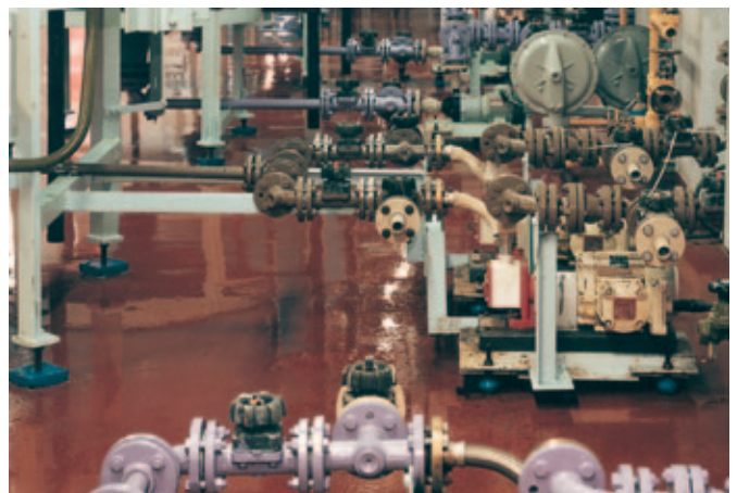
Nuestra referencia en Royston (Reino Unido): Johnson Matthey

Ampliamente utilizados para la limpieza y en las zonas CIP para la limpieza del proceso.