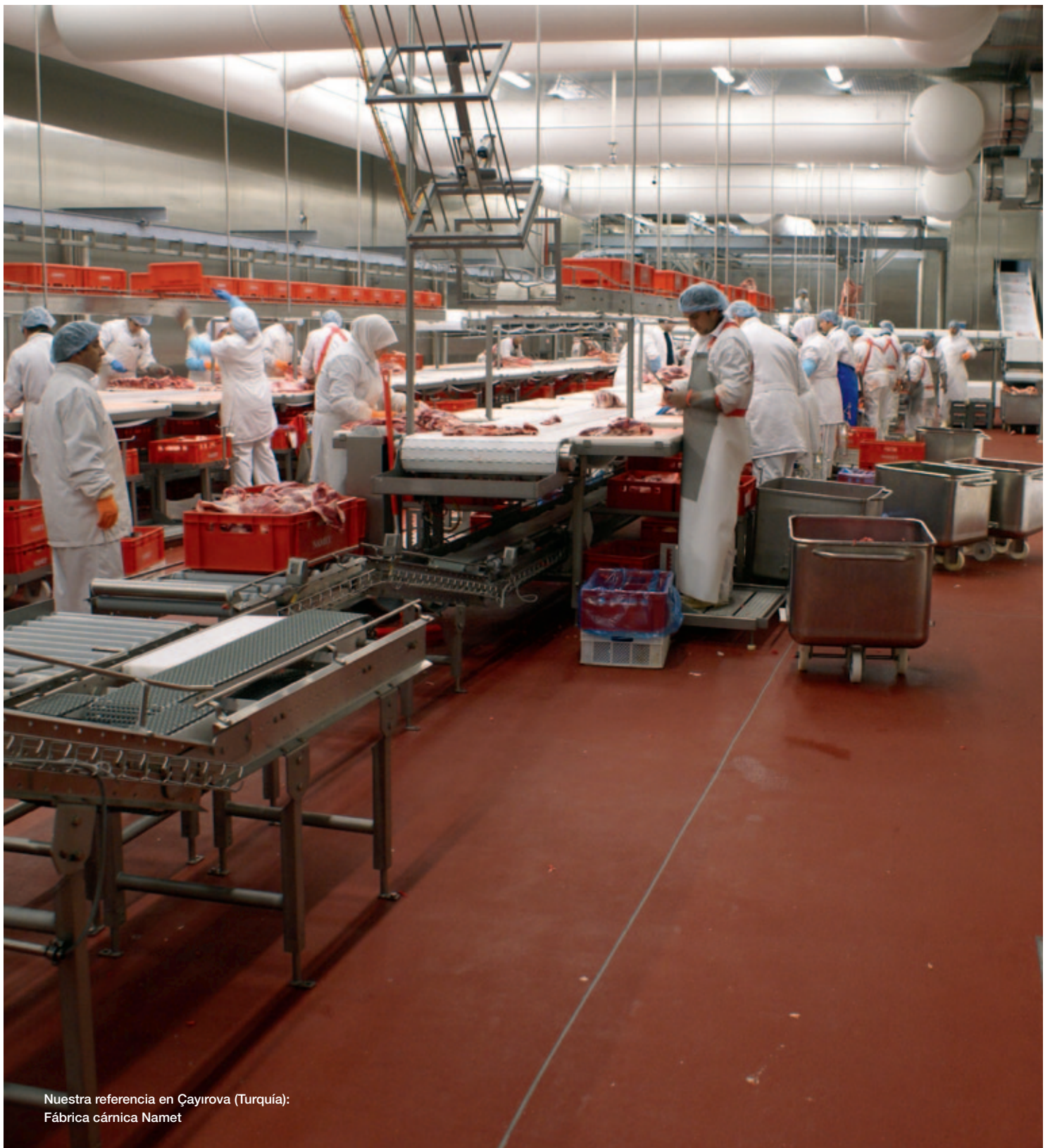
Nuestra referencia en Çayırova (Turquía): Fábrica cárnica Namet