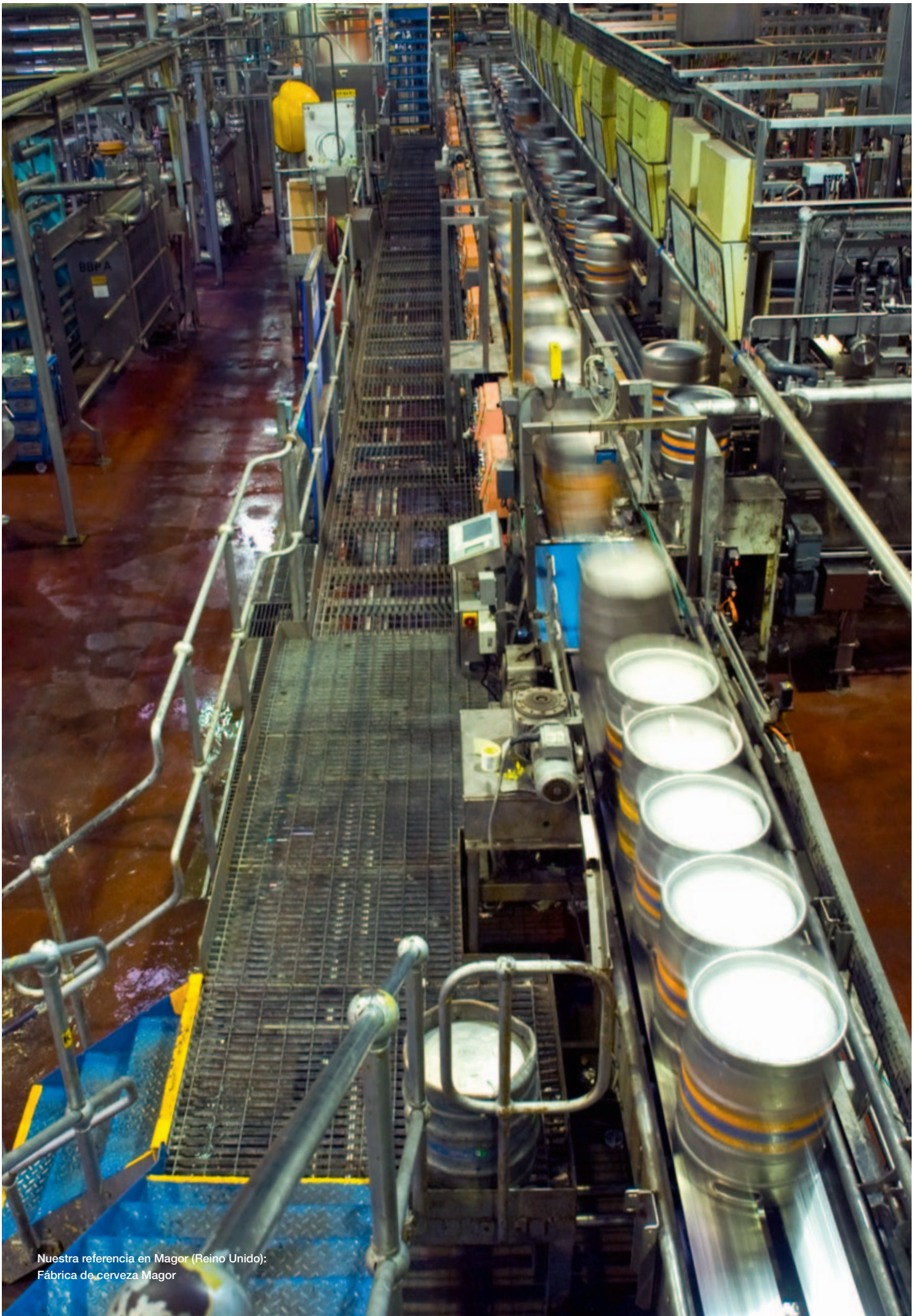
Nuestra referencia en Magor (Reino Unido): Fábrica de cerveza Magor