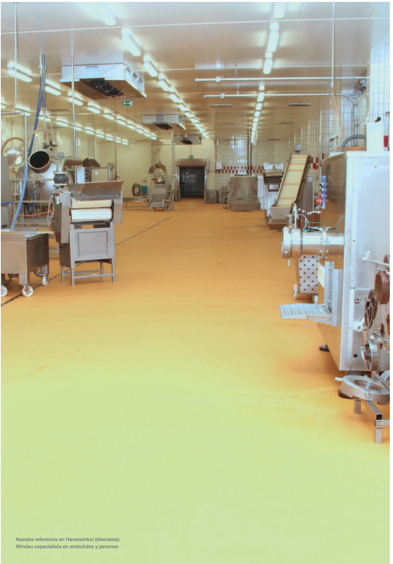
Nuestra referencia en Harsewinkel (Alemania): Windau especialista en embutidos y jamones