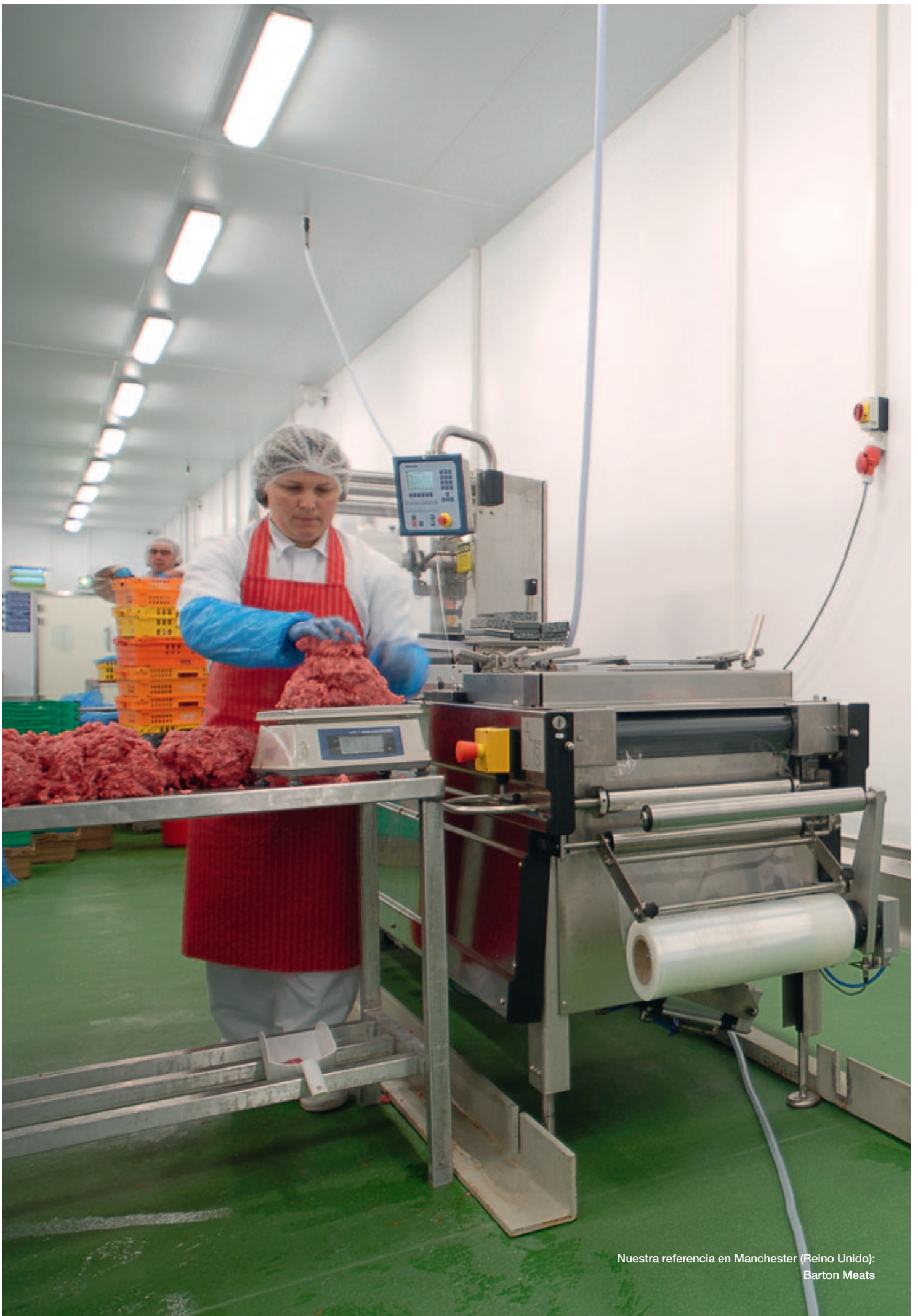
Nuestra referencia en Manchester (Reino Unido): Barton Meats