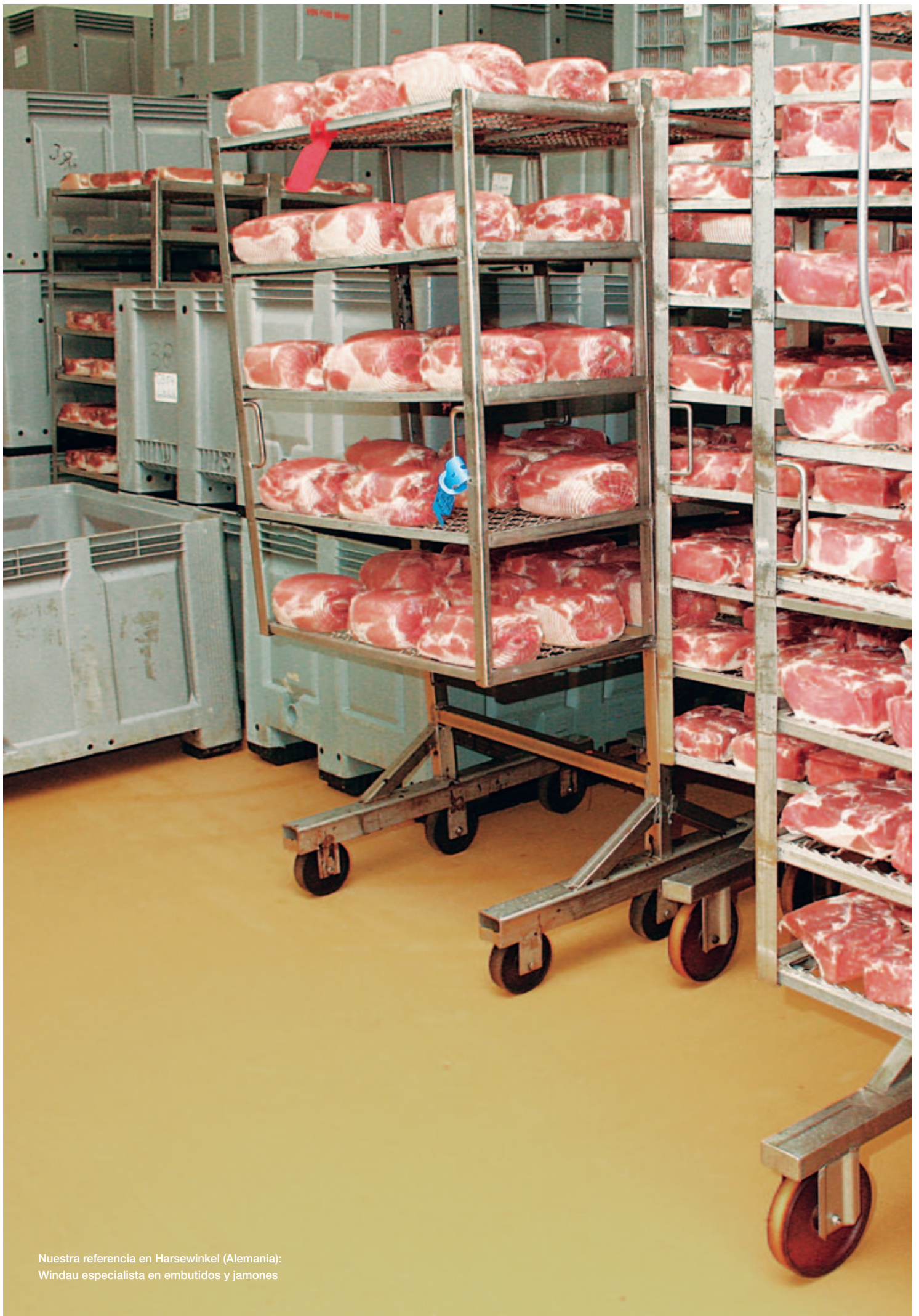
Nuestra referencia en Harsewinkel (Alemania): Windau especialista en embutidos y jamones