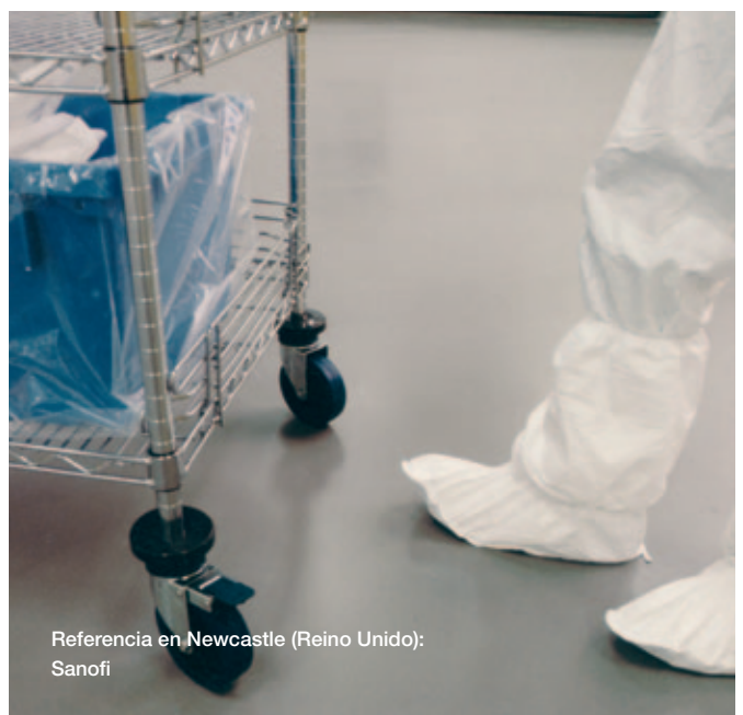
Referencia en Newcastle (Reino Unido): Sanofi

A diferencia de los suelos de terrazo convencionales, Ucrete TZ puede colocarse prácticamente sin juntas y también está disponible en versión antiestática. Dependiendo de la resistencia a la temperatura que se desee, están disponibles espesores de entre 9 y 12 mm.