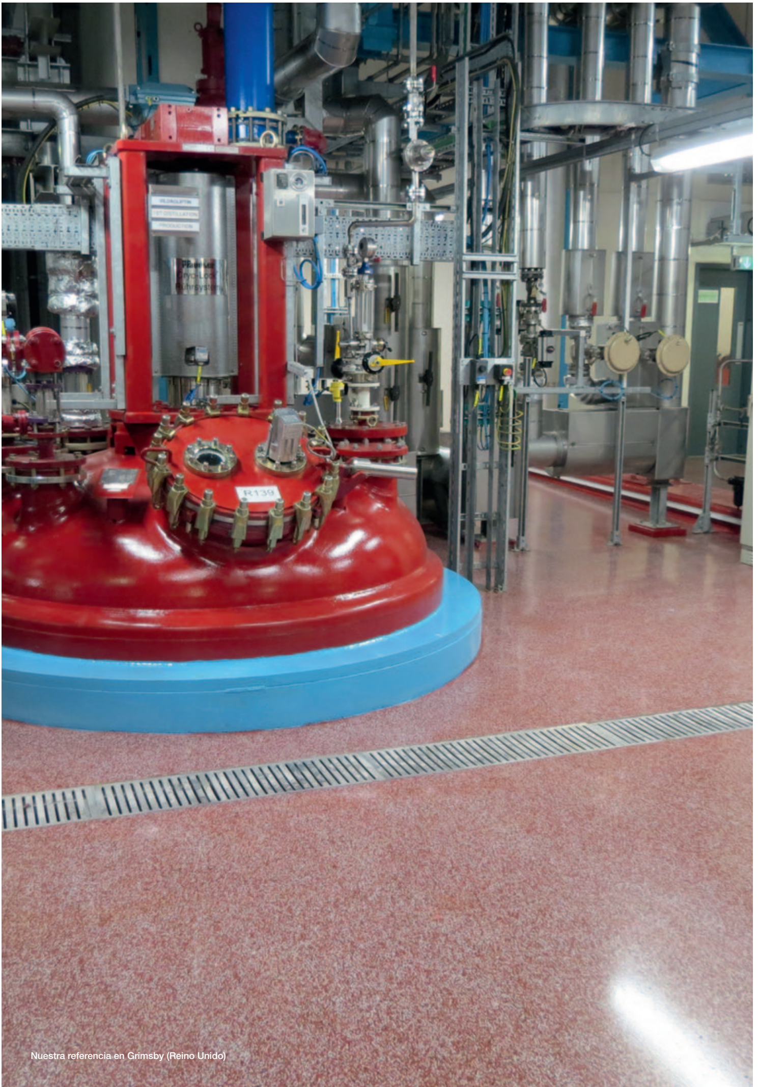
Nuestra referencia en Grimsby (Reino Unido)