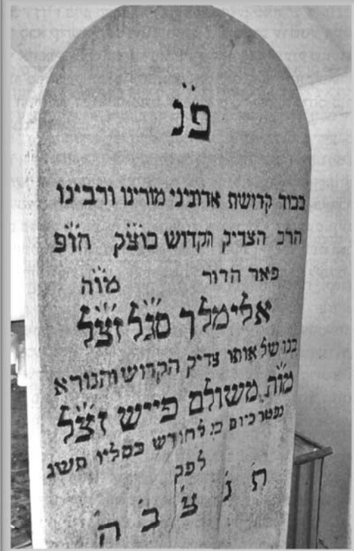
▲ מצבת רבינו בעיר טאהש, אונגארן