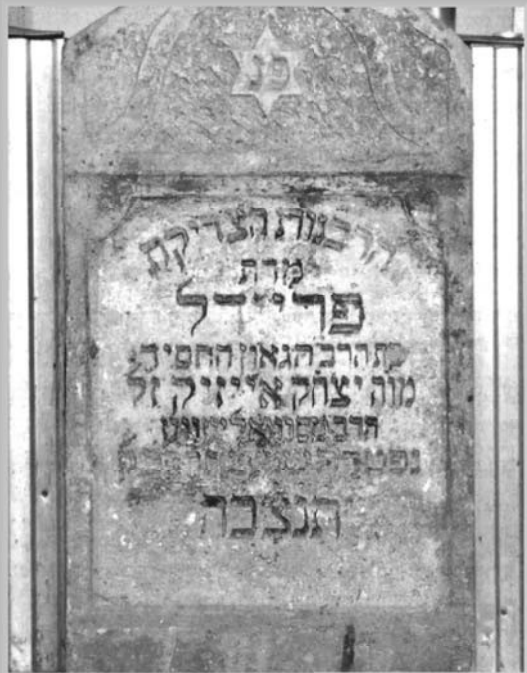
▼ מצבת הרבנית הצדיקת מרת פריידל ע"ה בעיר טאהש, אונגארן