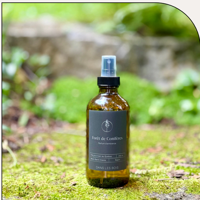
FORÊT DE CONIFÈRES