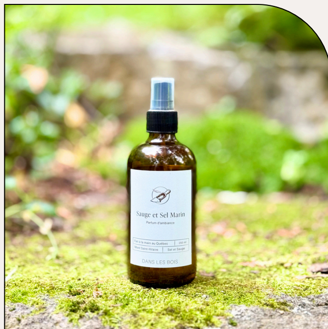
SAUGE ET SEL DE MER