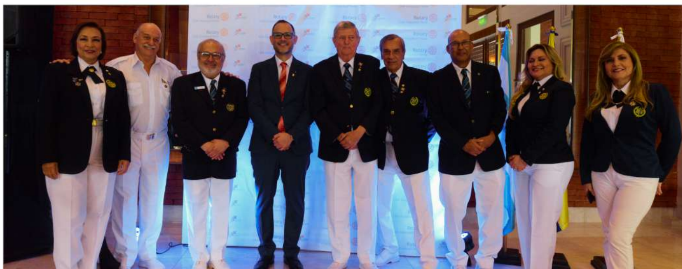
PRESENCIA DE LA FLOTA GUAYAQUIL DURANTE NUESTRO EVENTO.