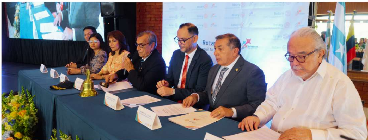
MESA DIRECTIVA DE LA POSESIÓN DE LA NUEVA DIRECTIVA DEL CLUB ROTARIO GUAYAQUIL NORTE.