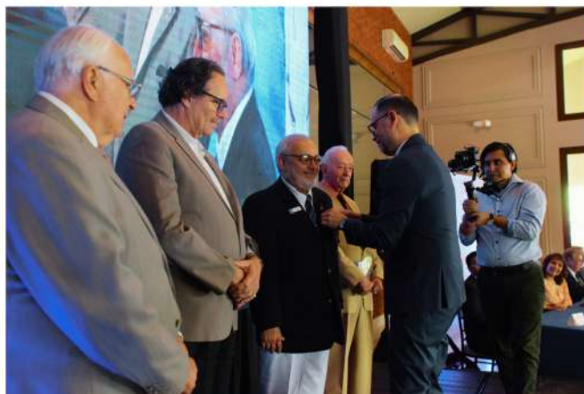
MOMENTOS DE LA INCORPORACIÓN DE NUESTROS SOCIOS HONORARIOS DEL PERÍODO 2024-2025