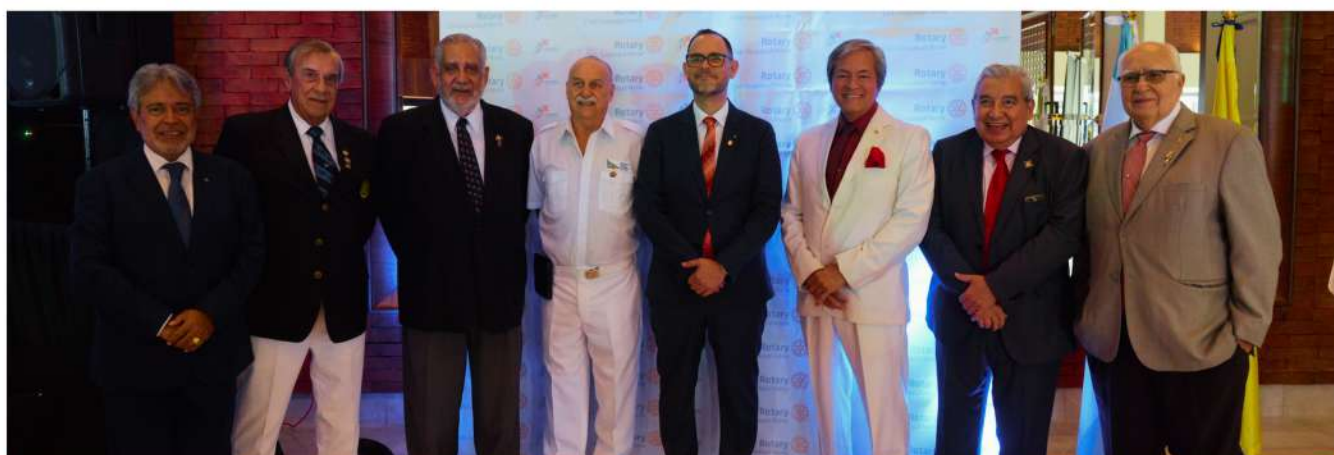
CONTAMOS CON LA ASISTENCIA DE 7 GOBERNADORES A NUESTRO EVENTO.