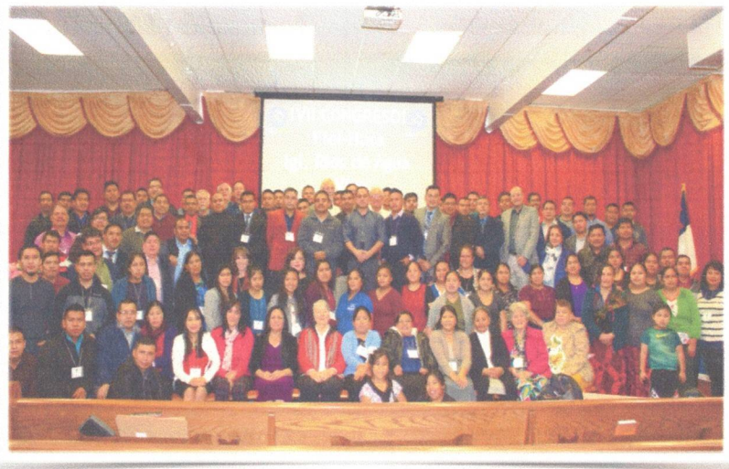
Foto oficial del equipo de servidores, tallistas, conferencistas y organizadores de nuestro congreso.

También Tuvimos la oportunidad de alabar al Señor a una sola voz cantando esos cantos que nos animan a seguir sirviendo y honrando al Señor en unidad. Fuimos dirigidos a cantar al Señor por un grupo de alabanza formado por integrantes de diferentes lugares que nos bendijeron grandemente con sus talentos musicales.