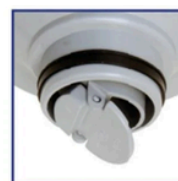
Empaque de Ajuste