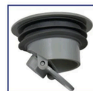
Válvula Antiolores (VAO*)