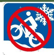
Panneau d'interdiction aux fatbikes