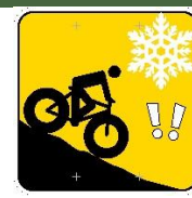
Panneau fatbike - Attention (pente, obstacle, croisement, etc)