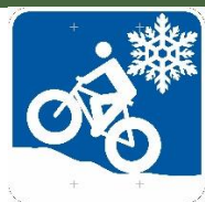
Panneau sentier de fatbike