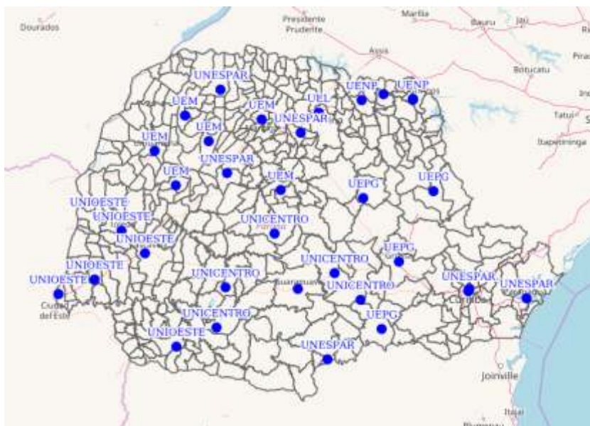
Figura 01: Mapa Georreferenciado do Ensino Superior do Paraná.