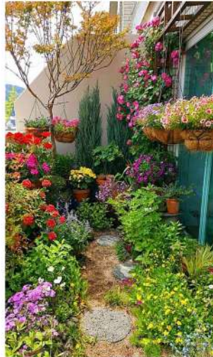
FLEURS EN TERRE