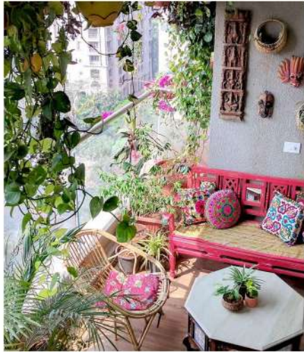
FLEURS EN POTS