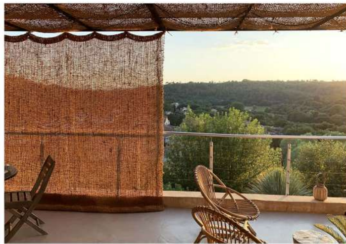
TISSAGE EN FIBRES NATURELLES

Bien s'isoler de son voisinage et se protéger aussi du soleil rend cet espace accueillant pour s'y reposer à l'abri des regards.