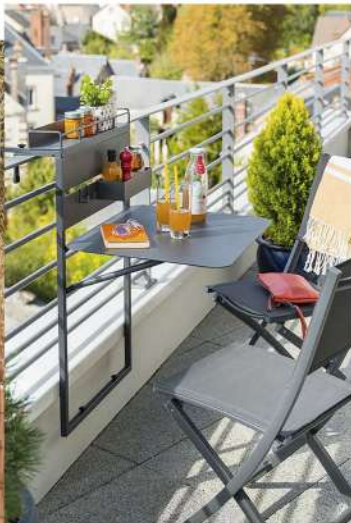
TABLETTE FIXÉE AU BALCON