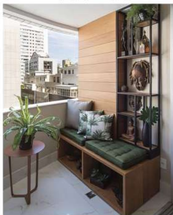
MOBILIER SUR MESURE

Bien aménager son balcon en fonction de sa surface permettra de l'utiliser pleinement. Le secret : plurifonctionnalité dans la modularité !