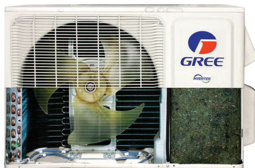
Base avec élément chauffant

Les unités extérieures de la Lomo 23 sont équipées d'une base chauffante qui empêche le condensat de geler, assurant ainsi une pleine efficacité du chauffage.