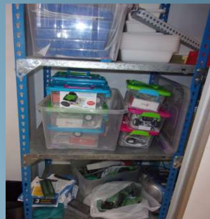
Taller de Robòtica