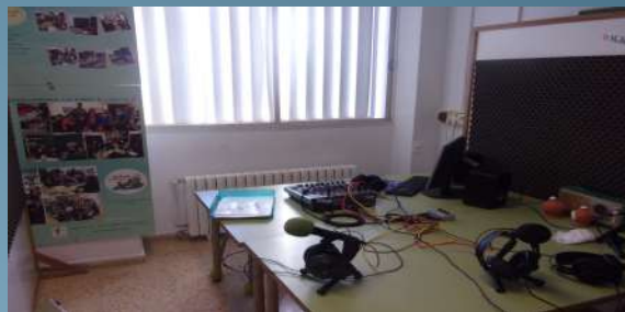
Taller de Ràdio