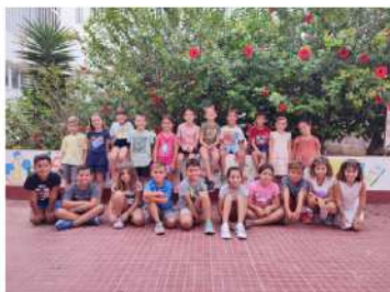
Inici de curs

Aquest curs ha estat ple d'emocions, bons moments i moltes vivències.