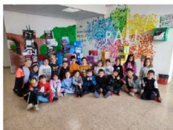
Dia de la Pau