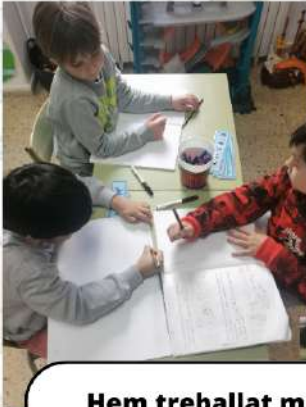
Hem treballat moltíssim...