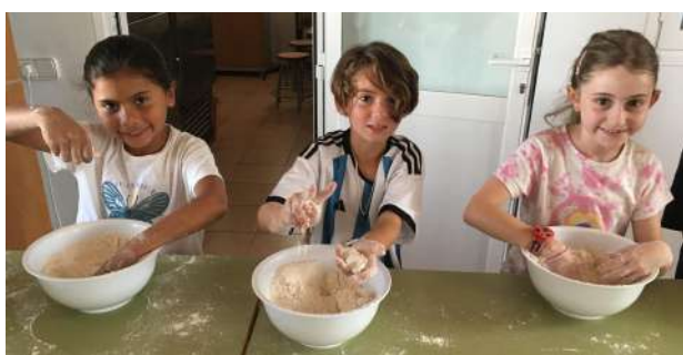
Què divertit pastar!