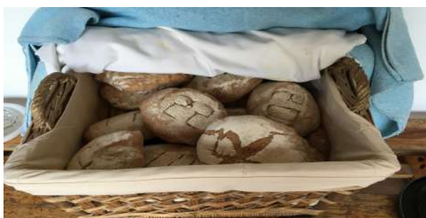
Feina feta, ara a menjar!