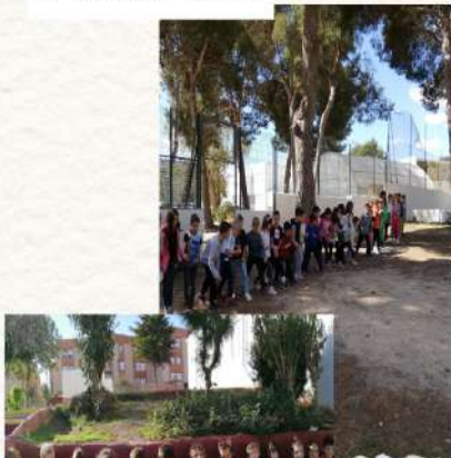
I més xocolata!!