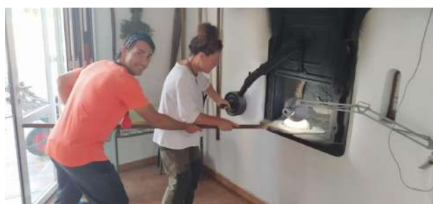
Controlar la temperatura del forn no és gens fàcil.