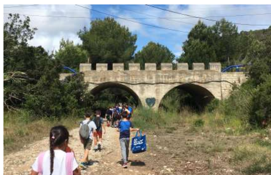
Fent la passejada pel torrent.