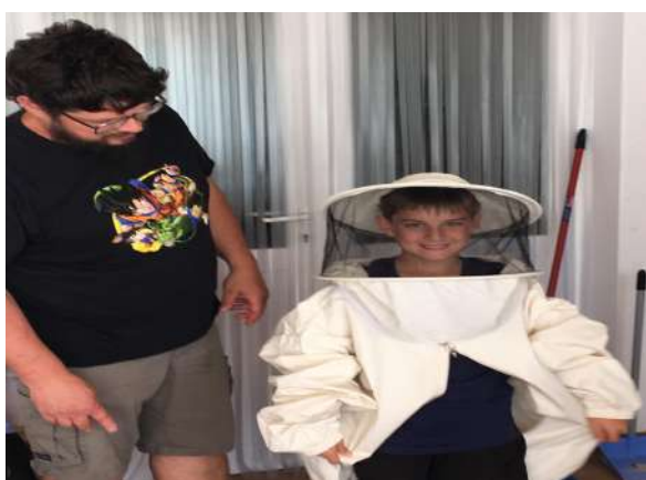
Estic preparat per treballar. Qui s'apunta?