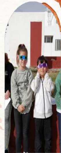
Ens posem les ulleres liles