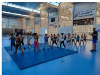
Fira de l'esport