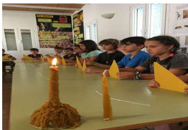
Les abelles fan moltes coses: mel, pròpolis, jalea real, pol.len i cera. A més POL.LINITZEN! CUIDEU-LES!!!