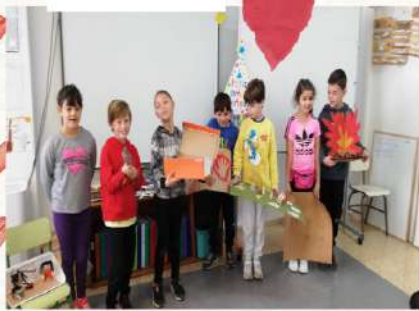
A cercar ous!!