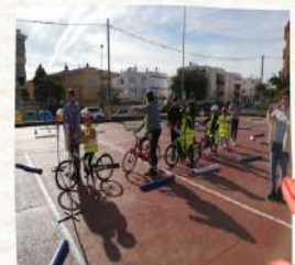
Life is good in bicycle