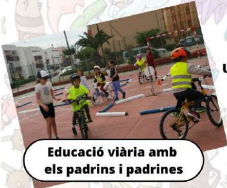
Educació viària amb els padrins i padrines