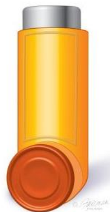
Proventil Inhalador de sulfato de albuterol