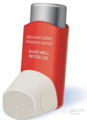
Pro-Air Inhalador de sulfato de albuterol