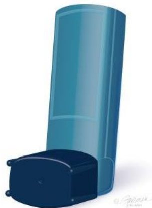
Ventolin Inhalador de sulfato de albuterol