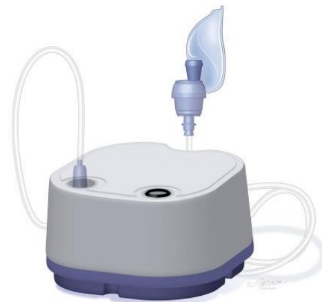
Accuneb Nebulizador de sulfato de albuterol

El albuterol es el medicamento de rescate (alivio rápido) más recetado para el asma. Es un medicamento de acción corta que debería comenzar a hacer efecto en un periodo de 10 a 15 minutos. Pregúntele a su médico con qué frecuencia debe usar este medicamento – no debe usarse para prevenir los síntomas. Se puede recetar para administrarlo con un inhalador o con un nebulizador.