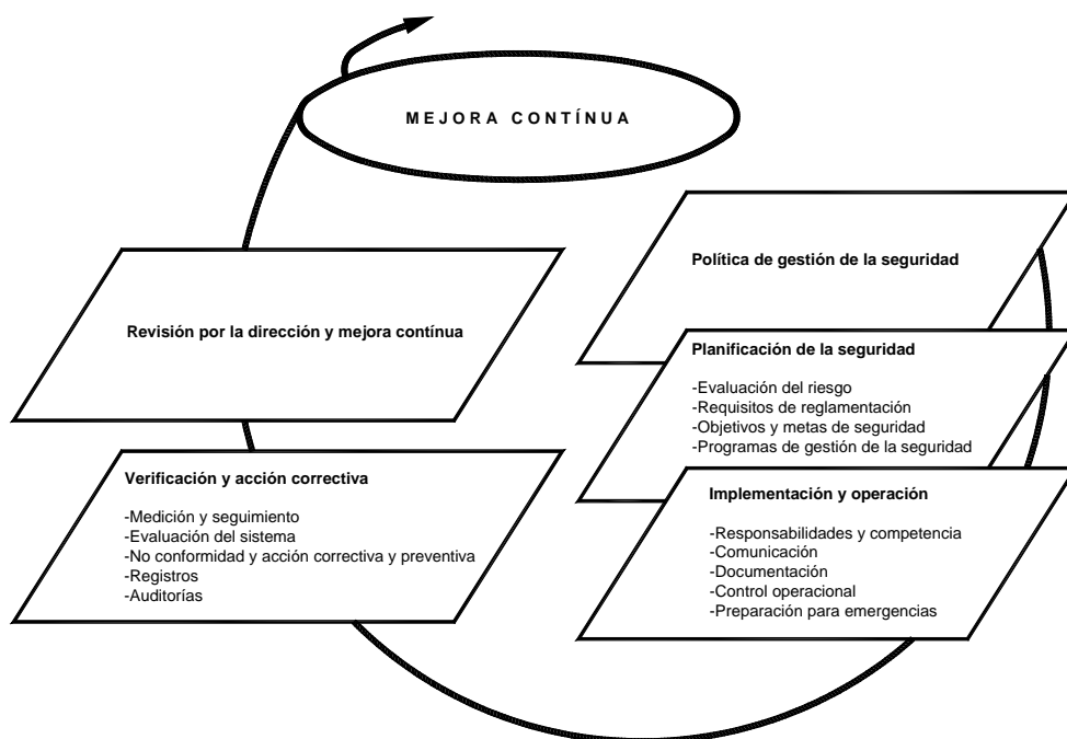
Figura 2. Elementos del sistema de gestión de la seguridad