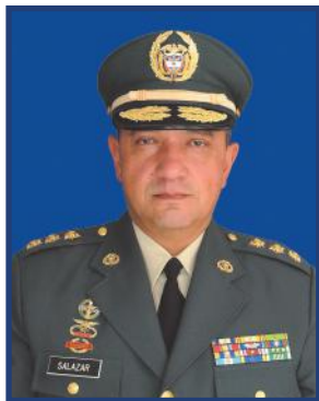
Palabras del señor Director de la Escuela Superior de Guerra, Mayor General Juan Carlos Salazar Salazar, M.Sc.

Diferentes tipos de amenaza se evidencian actualmente no solo en nuestro país sino también en las sociedades del hemisferio. El tráfico de armas, el crimen organizado, el tráfico de drogas, la minería ilegal, entre otras, son los temas que mueven las agendas de seguridad en muchos países