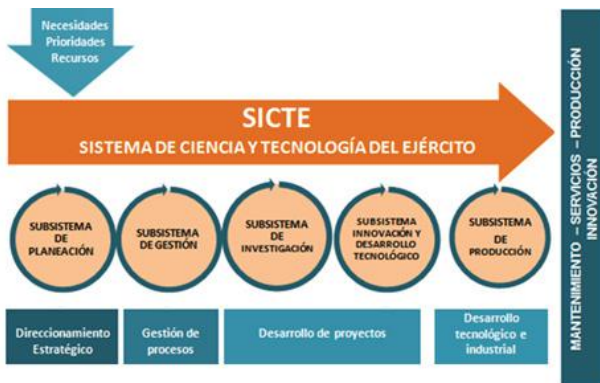
Figura No.1 Sistema de Ciencia y Tecnología del Ejército Nacional.

Los diferentes programas, proyectos y líneas de investigación que actualmente existen en el SICTE son prueba fehaciente de las capacidades, creatividad e innovación de los hombres y mujeres de esta Fuerza, hechos manifiestos en todo tipo de resultados ya documentados y protegidos desde los derechos de autor y las patentes.