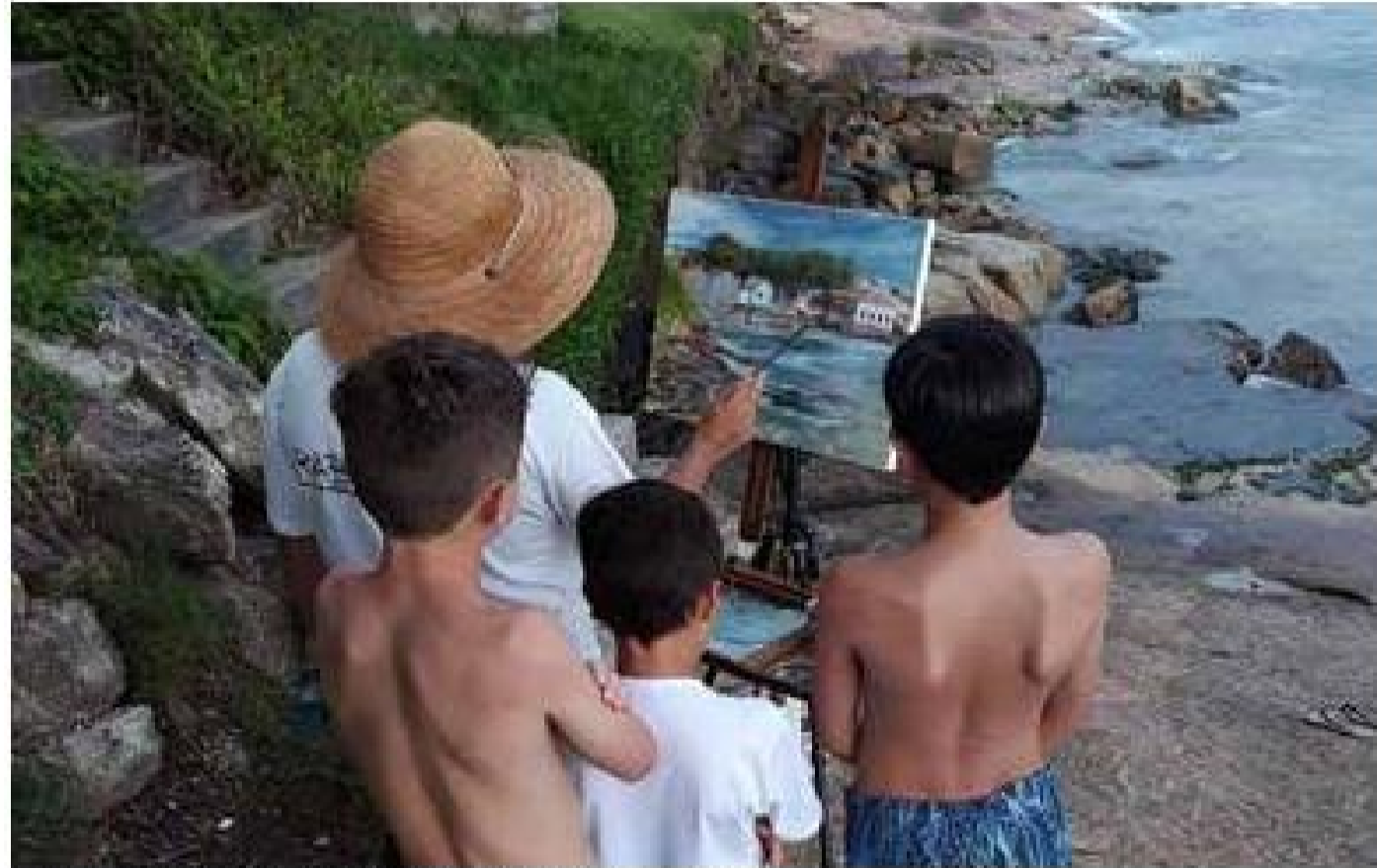
Público só vai poder acompanhar pela internet

Evento reúne artistas nacionais e internacionais em extraordinário encontro de artes plásticas que vai se dar na segurança dos caminhos eletrônicos da rede mundial