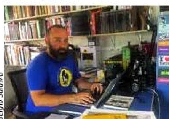
Manohead: a tradição da pintura ao ar livre num meio futurista

Começa nesta quarta-feira (24) o 3º Encontro de Pintura ao Ar Livre de Garopaba, evento previsto para março do ano passado que acabou adiado pela pandemia. O coronavírus veio pra ficar, mas o conagraçamento teima em acontecer. Desta vez, será um festival virtual, com participação dos principais convidados e mais de uma centena de inscritos. Criado com participação comunitária e já alcançando repercussão internacional, o encontro vai marcar época pela solução criativa e pela resistência. Manohead explica como vai ser: