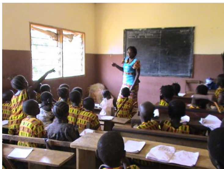
CLASE DE MATEMÁTICAS