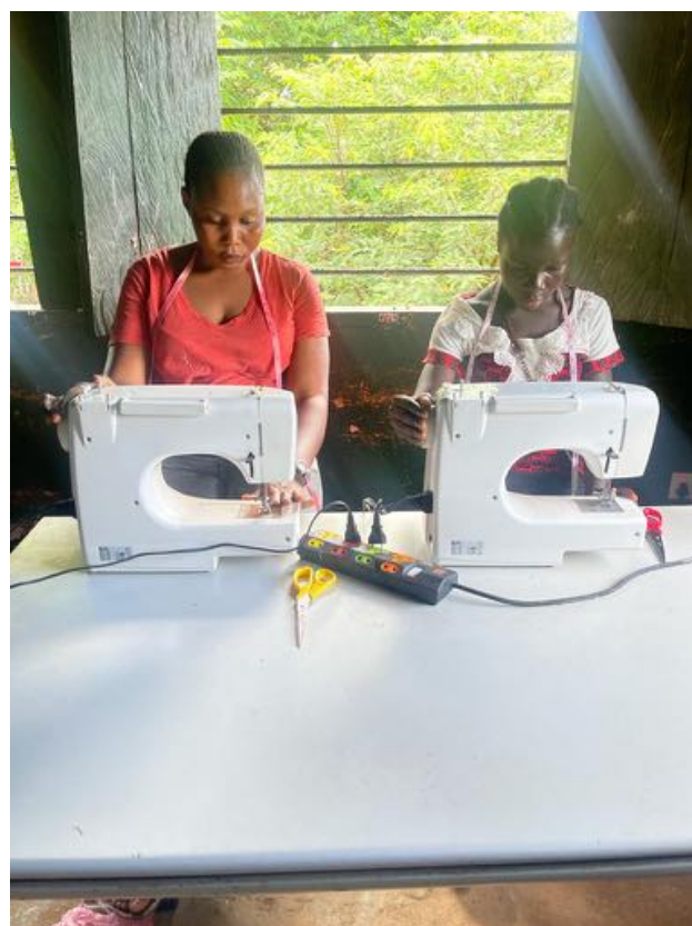
Taller de confección