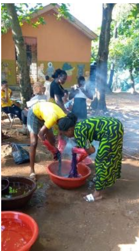
Taller de teñido de telas