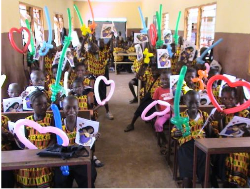
TALLER DE MANUALIDADES