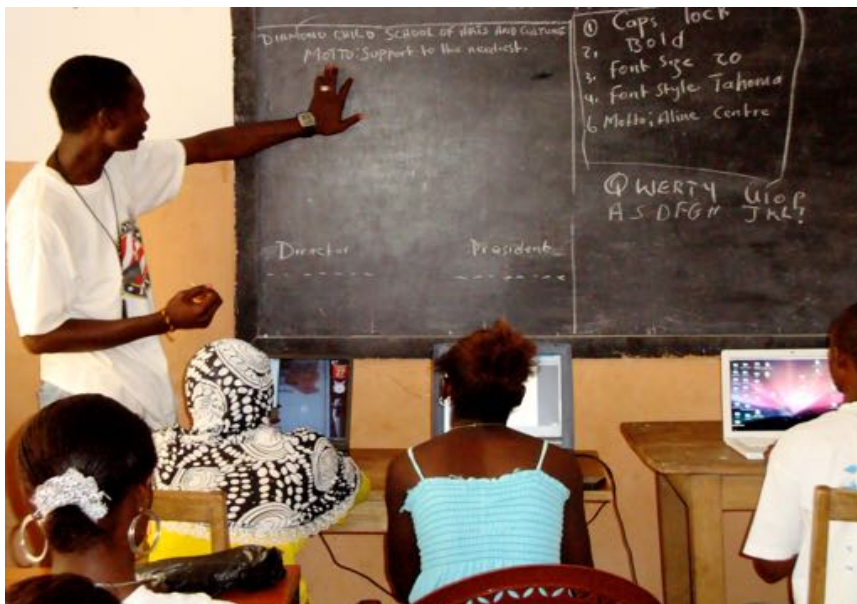
TALLER DE INFORMÁTICA