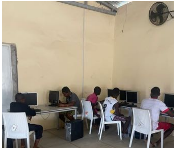
Aula del Centro de Tecnologías de la Información y Comunicación en Kissy- Freetown-