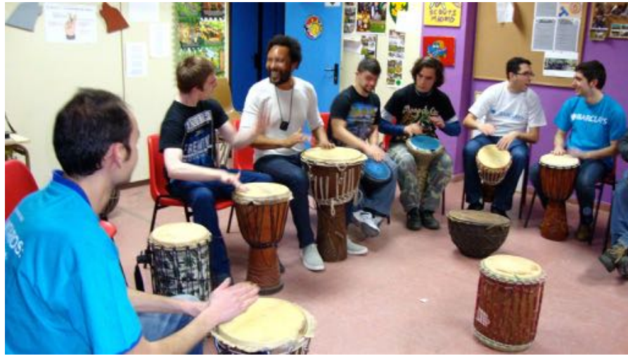
Taller de percusión con empleados de Barclays y chicos con síndrome de down.