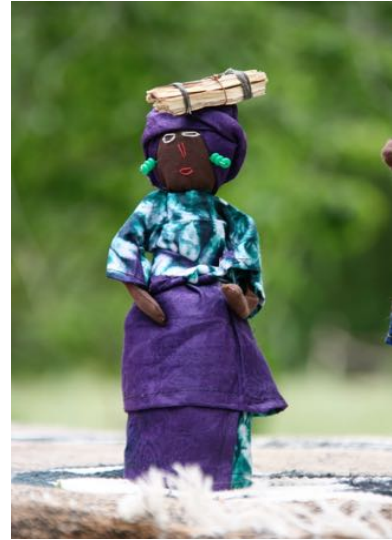
muñeca africana hecha con madera