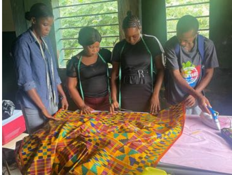
Taller de corte y patronaje