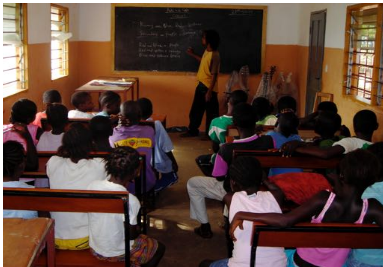
CLASE DE LENGUA

Los alumnos-as tienen edades comprendidas entre los 5 y 30 años. Por las mañanas van los niños-as de 5 a 13 años que aprenden enseñanza básica y música.