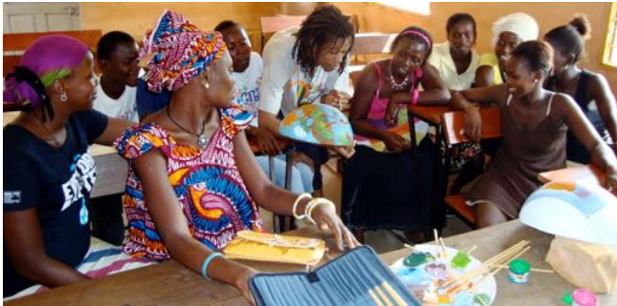
TALLER DE ARTESANIA Y PINTURA