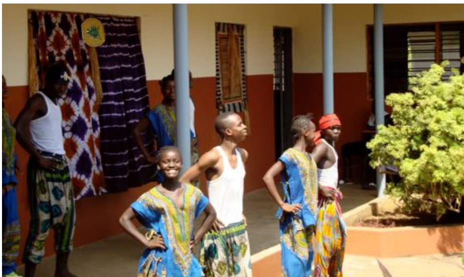
CLASE DE DANZA

La escuela-taller es totalmente gratuita. Les proporcionamos material escolar, y todo lo necesario para los talleres que se imparten.