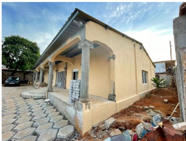
Edificio del Centro de Tecnologías de la Información y Comunicación en Kissy- Freetown-

FINANCIACION: ONG Por África y Fondos propios