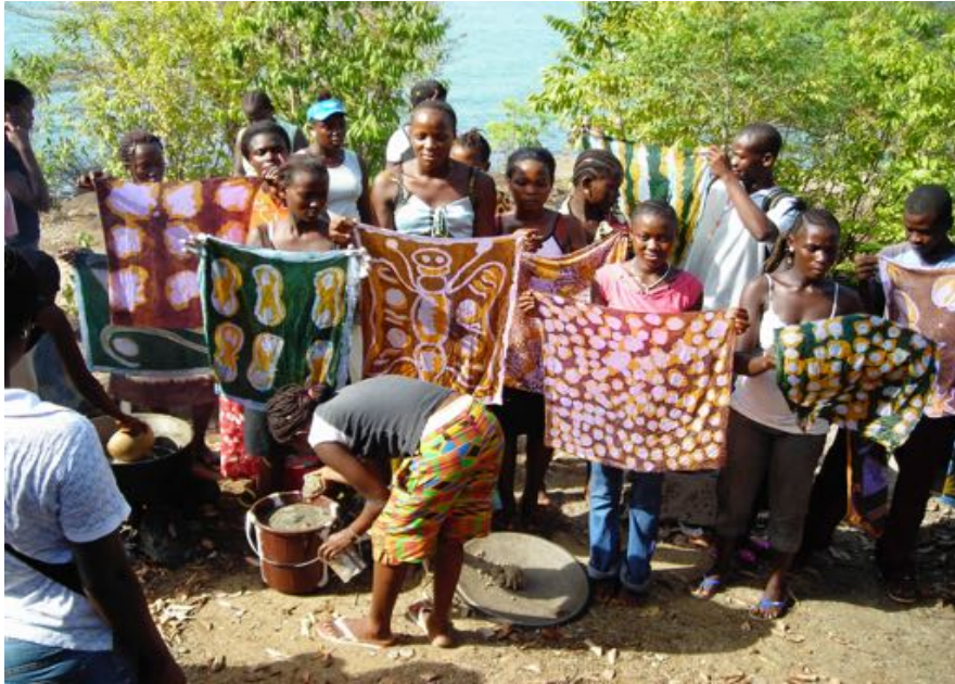
TALLER DE BATIK

La escuela cuenta con 9 profesores fijos, 1 jardinero y 2 guardianes. Cada mes se realizan talleres intensivos, algunos dirigidos a las mujeres de la Comunidad que no pueden asistir regularmente.