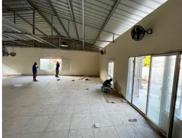
Interior del Centro de Tecnologías de la Información y Comunicación en Kissy- Freetown-