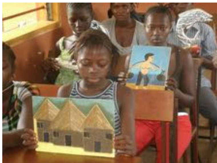
Cuadros y artesanía