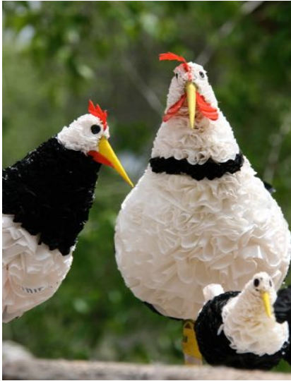
animales hechos de bolsas de plástico

En la escuela-taller se fabrican instrumentos musicales, artesanía, tapices, batiks, bisutería, etc que, se venderán a través de redes de comercio justo en España con las que ya hemos contactado y así Diamond Child School se autofinanciará y será sostenible por sí misma.