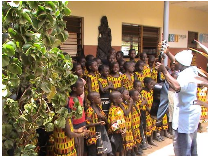
TALLER DE CANTO