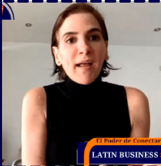
El Poder de Conectar LATIN BUSINESS