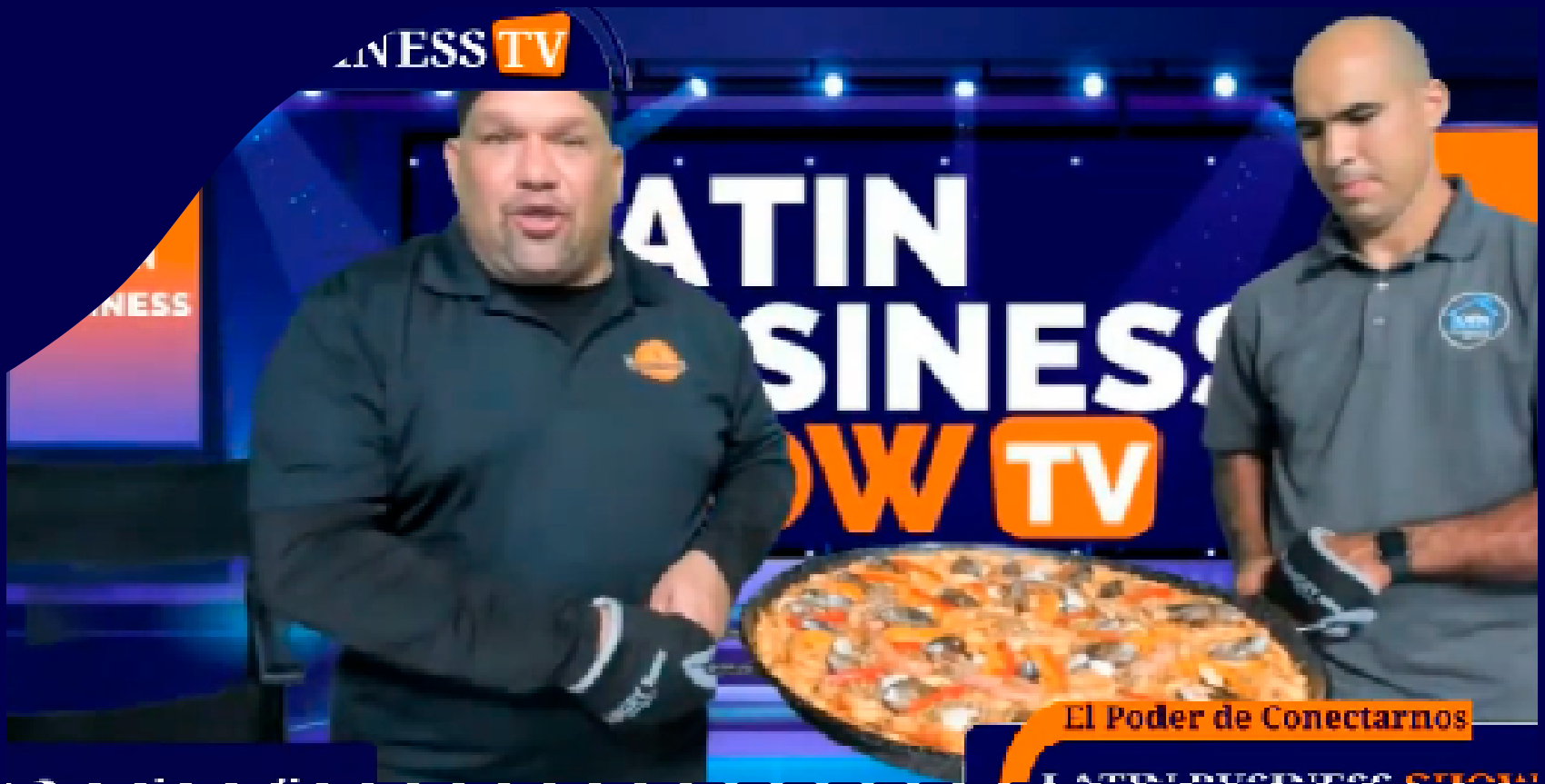
El Poder de Conectarnos