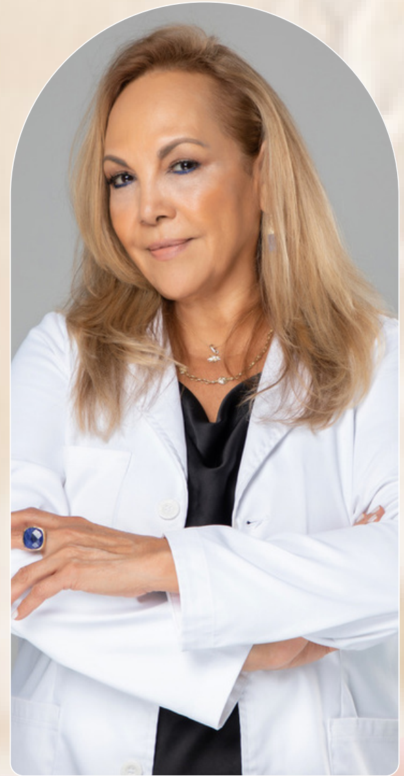
Esteticista Holística y Terapeuta Holística, Creadora de Amalia Natural Skincare