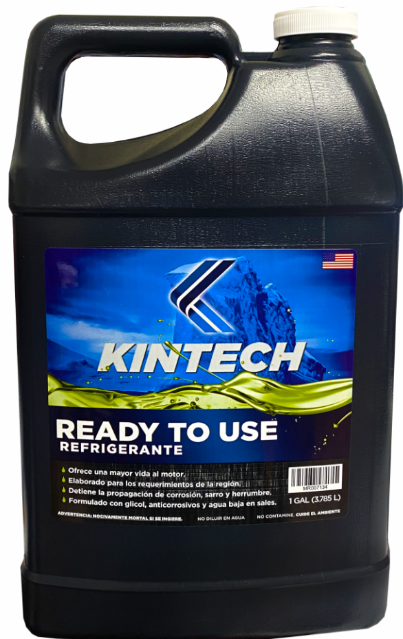
REFRIGERANTE READY TO USE