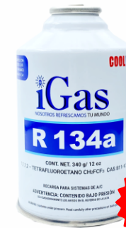
LATA GAS FREÓN 134A