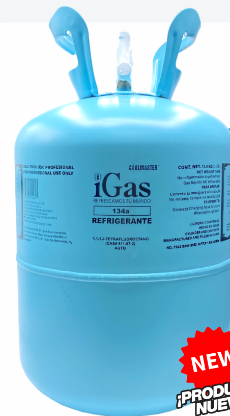
MINA GAS FREÓN 134A