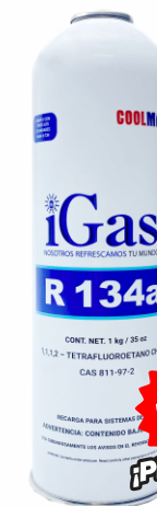
LATA GAS FREÓN 134A