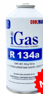
LATA GAS FREÓN 134A